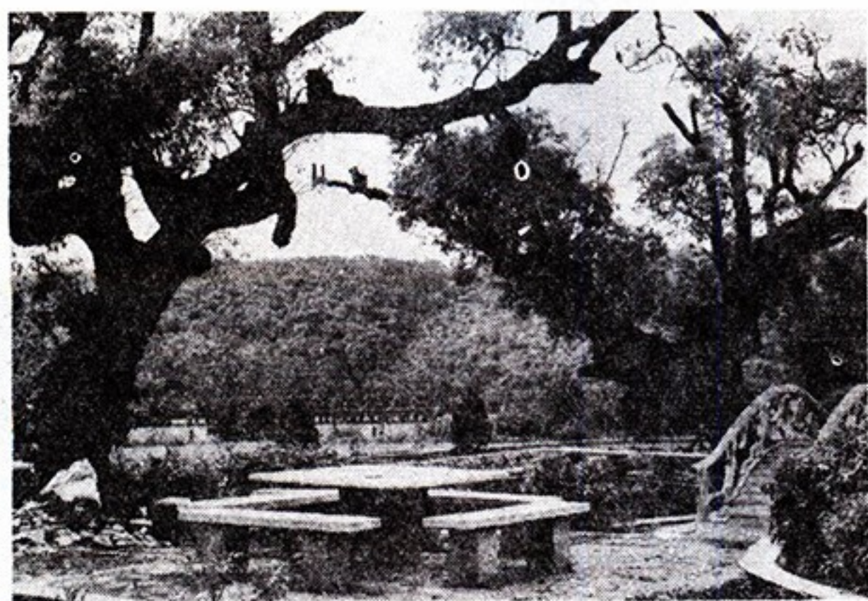
光風外門堂祠和義周南汝

該祠堂之正殿，供奉周氏歷代祖先總牌位一方，是爲臺灣最大的牌位，亦莊嚴，亦偉觀。其老式殿宇之牆角，處處設有彫刻精巧的長方形石柱脚，以求增加美觀。按在牆角設置長方形石柱脚之風俗，向爲桃園、新竹兩縣客家地區所特有，在臺灣漳泉人地區可以說是實屬罕見。