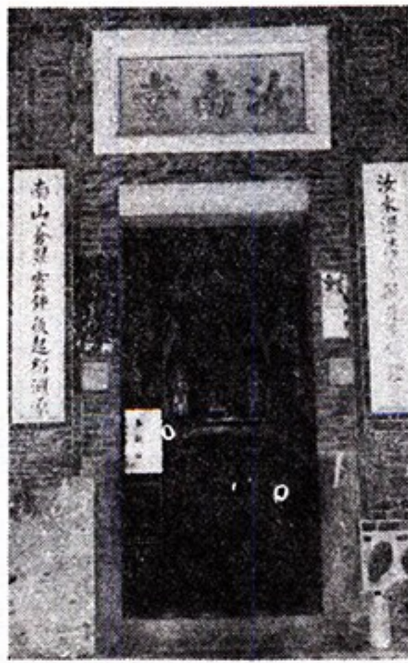
殿正堂祠和義周南汝