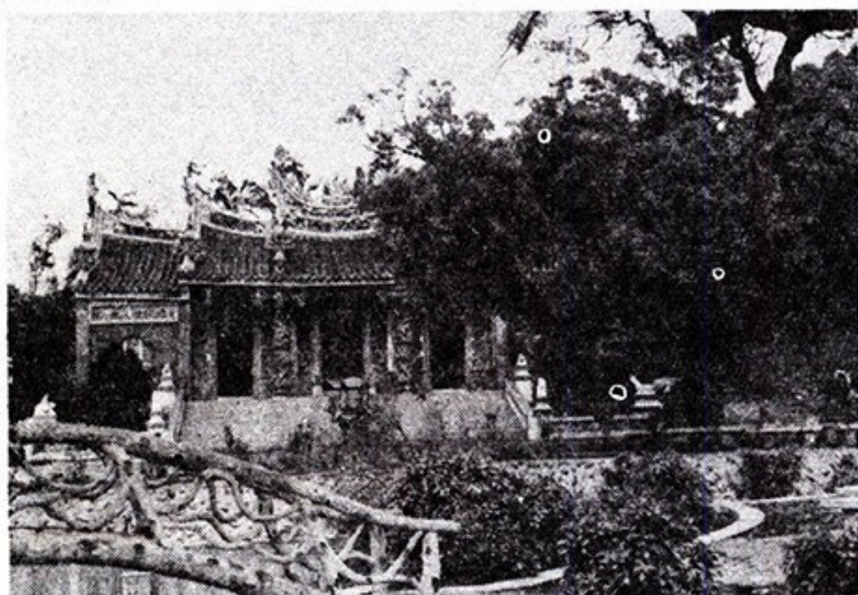
門川山堂祠和義周南汝