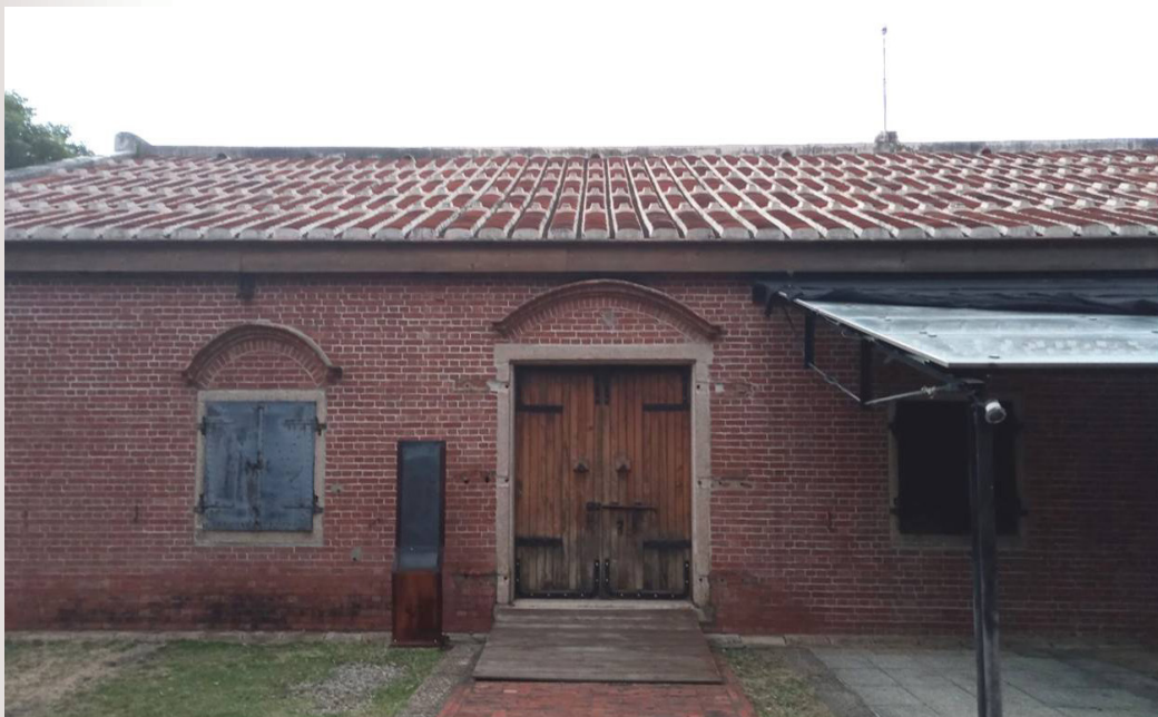
圖 1 嘉士洋行倉庫（即淡水殼牌倉庫、淡水文化園區）現況。