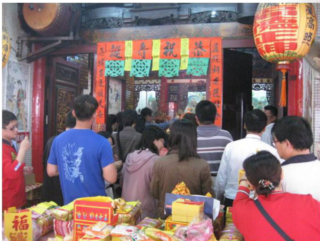
圖 4 大埔福德祠聖誕活動

特色。這種跨地域文化資本的建構，是廟方在以「補財庫」這個詞彙作為宣傳策略下的靈力經濟。