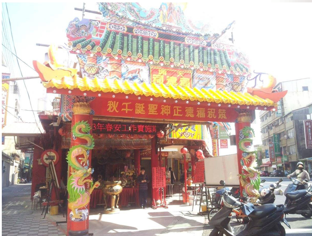
圖 1 臺南市六合境大埔福德祠（臺南市中西區開山路 203 號）