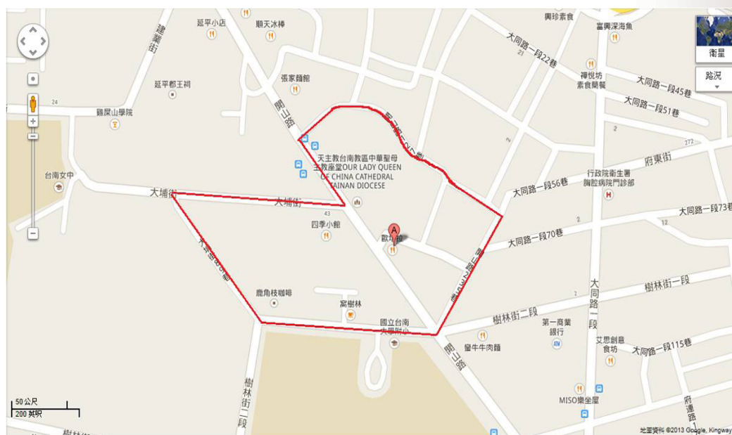
圖 5 大埔福德祠轄境範圍圖

普渡的時候，平日轄區外的信徒一般不會來參加，因此從靈力生產的角度來看，轄區內居民的參與就變得很重要，是營造普渡熱鬧場面的重要資源來源。此外，轄區內的信徒也是信徒大會代表的主要來源，廟宇幹部也是從中遴選。因此對廟宇來說，轄境內的信徒也是重要的社會資本。換言之，轄境對大埔福德祠來說，不僅具有宗教文化上的意義，也具有社會動員上的意義。這也是轄境在廟宇經營上的意義，亦即它在靈力經濟上的意義。 40 這種宗教文化與資源動員上的意義，使得大埔福德祠既是一個去地域化的廟宇，也是一個具有地域性的廟宇。