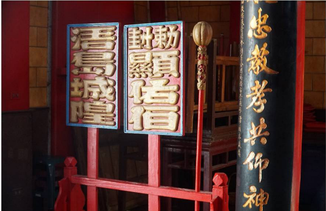
圖 7 浯島城隍廟「敕封顯佑伯」執事牌