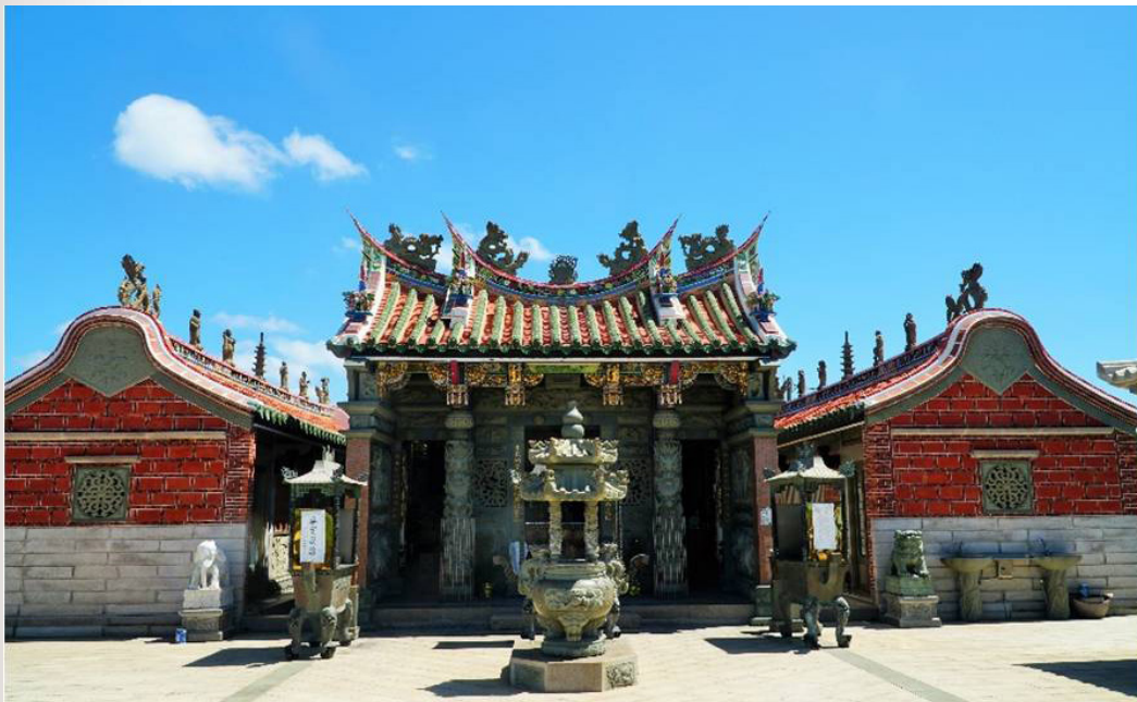
圖 9 田浦東嶽泰山廟

以京都都城隍福明王自居，下轄省、府、州、縣各地方層級的城隍神， 89 則該廟將香火起源、廟名、神名皆與之相連結，實有提升其神格地位的用意，標榜自身在眾城隍之上，仍是一種等級性的表現。