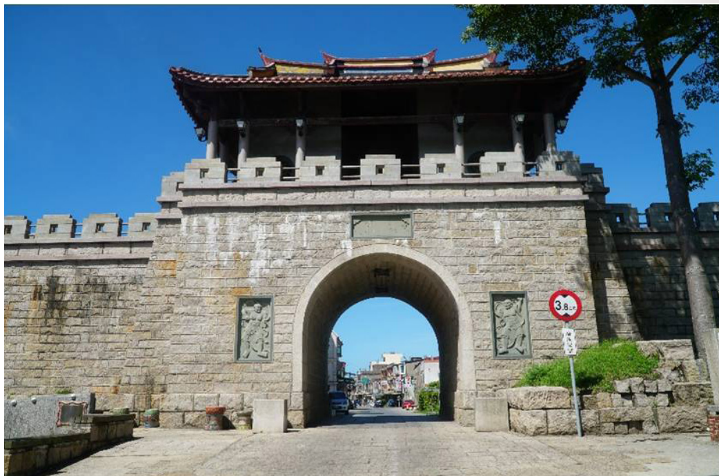
圖2 金門所城北門現況

成書於明弘治2年（1489）的《八閩通志》，記載該城的形制曰：「周圍六百四十丈，高連女牆一丈七尺，城台廣一丈，為窩鋪二十有六，東、西、南、北關四門，各建樓其上。永樂十五年，都指揮古祥等增高城垣三尺，並砌西、北二月城。正統八年，都指揮劉亮督同本所千戶陳旺復增各門敵台。」 9 可見該城的規模雖然不大，但防禦設施頗為齊全。永樂15年（1417）與正統8年（1443）皆是因應倭患加劇，而在短時間內增高城牆、加築月城與敵樓， 10 以提升防禦能力，凸顯軍城的性質與目的。