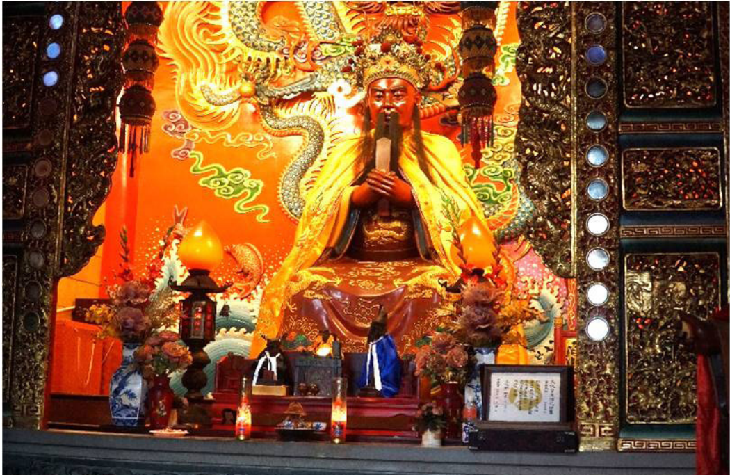
圖 8 金門（浯島）城隍神，右下方為「重要民俗」指定證書

相較於古地、浯島城隍廟，遠在本島最東隅的田浦城隍廟，既無作為治所的行政地位，亦無與地方官對應的崇高神格，僅為田浦自然村之村廟。該廟自明初創建以來，雖經田浦巡檢司裁革、人口大量移出，但香火仍能延續至今，主要與田浦城的留存有關，這使得其依然被視為城市守護神。1968年駐軍長江部隊重新修築城牆，居民亦在隔年完成城隍廟的修復，顯見兩者之緊密關係。不過，除了自然神屬性外，田浦城隍神作為此地的境主，居民信眾亦希望提升其等級地位。1999年該廟發起重建，開始出現其主神為東嶽城隍爺，乃從山東泰山東嶽城隍廟分火而來，為大陸東南沿海唯一分爐之說。 88 2007年重建落成後，廟名亦定為「東嶽泰山廟」，碑文記載其神「直屬於東嶽大帝，職位尊隆」。由於民間信仰常將東嶽大帝比擬為人間帝王，