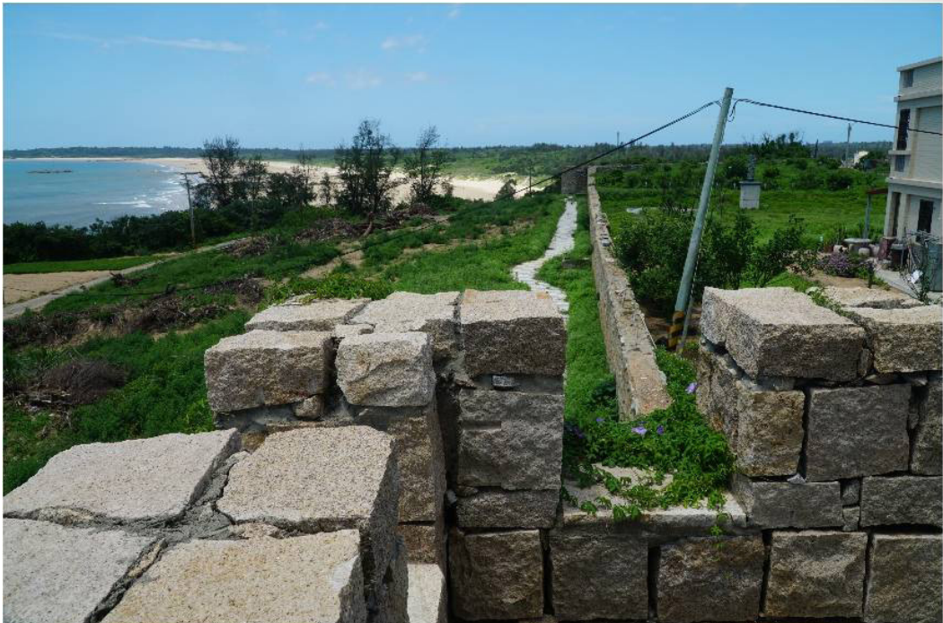
圖 3 現存田浦城殘蹟

衛、所構成嚴密的海防體系。 25 金門的五處巡檢司即為海防而設，《八閩通志》記載其皆有建城，其中田浦巡檢司城的形制為「周圍一百六十丈，廣一丈二尺，高一丈八尺，為窩鋪凡四，東西關二門。」 26 一般認為城隍廟即與該城同時所建，甚至在 1959 年後的多本金門方志中，還稱其為本地最早的城隍廟。 27