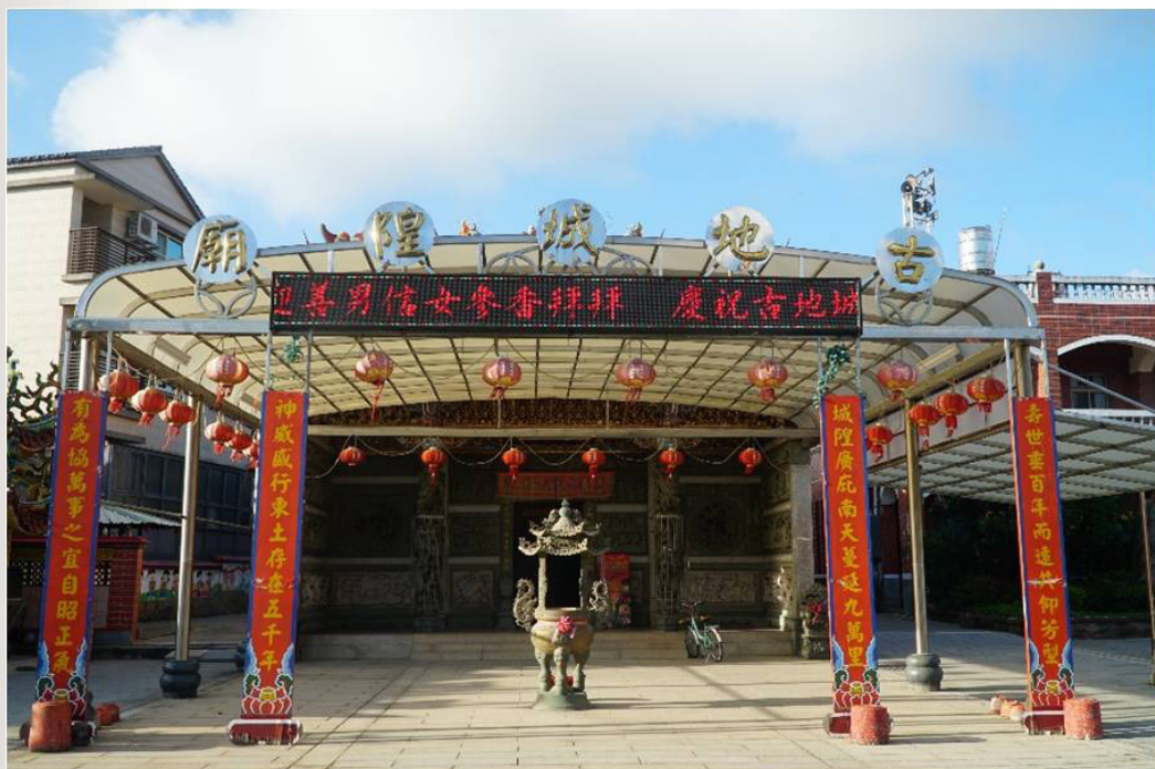
圖 6 金門城（古地）城隍廟

本地最高官署對應的地位，但卻能重現明代作為千戶所城的光榮歷史，這也是其後來廟名冠以「古地」的原因所在。