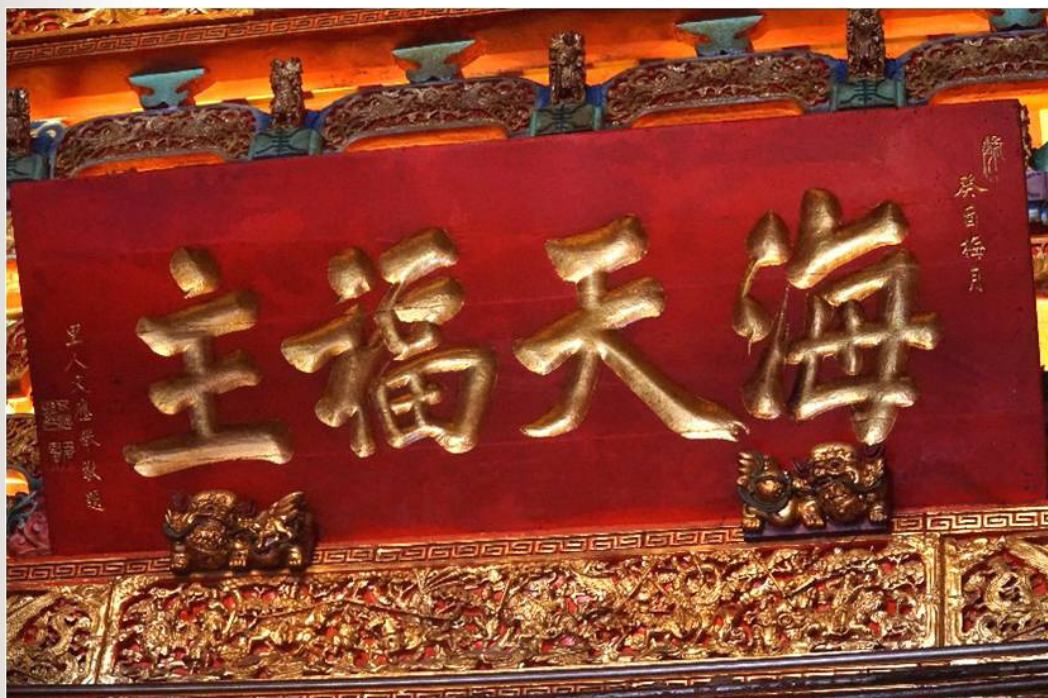
圖 5 文應舉自稱「里人」所贈之「海天福主」匾

如上所述，城隍廟具有行政治所的象徵性，又常被作為一種政治資源，以提高地方的行政級別。對於後浦而言，文武官署既皆已移駐此地，自然亦該有對應的城隍廟，才能凸顯其作為全金治所的地位，這是地方人士如此積極爭取建廟的原因所在。文應舉身為後浦人，本著回饋家鄉之心，承擔起建廟之責，確實是「以桑梓之建立為己任」，這從其在該廟落成所敬獻之「海天福主」匾，卻在落款處自稱「里人」，即可見證之。而對於全金門而言，興建城隍廟可彰顯其猶如縣級的行政位階，提升地方的重要性的榮耀感，因此在外任官的金門子弟，及全金各鄉居民也都慷慨解囊，合力助該廟順利建成。