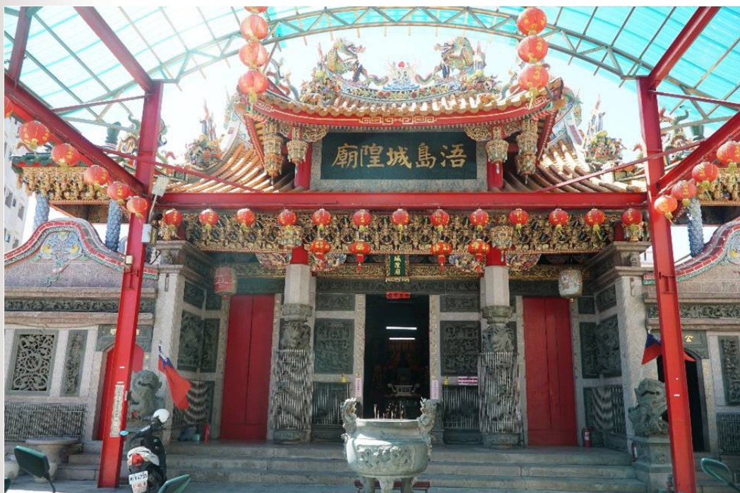
圖 4 後浦（浯島）城隍廟

通往縣城的同安渡。 37 由於有水運之利，元代即有陳、梁、許姓先民遷居至此；明代許姓族人已有四千餘人，而在此築有城堡， 38 鄭成功亦曾在此練兵。清初首任總兵陳龍將治所從所城遷至其北邊約四公里處的後浦，從此此地躍居金門的政治與經濟中心，也因而興建城隍廟，成為全島的信仰中心。