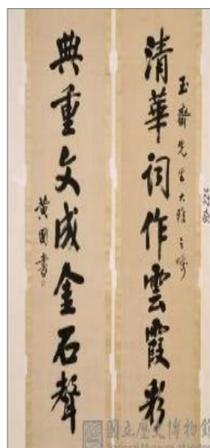
圖 1 《清華典重聯》