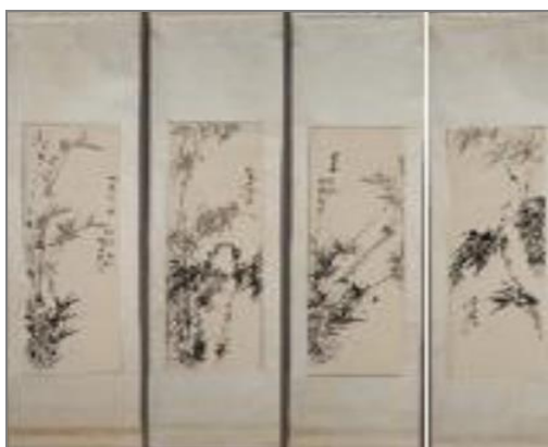
圖 3 《指畫墨竹》