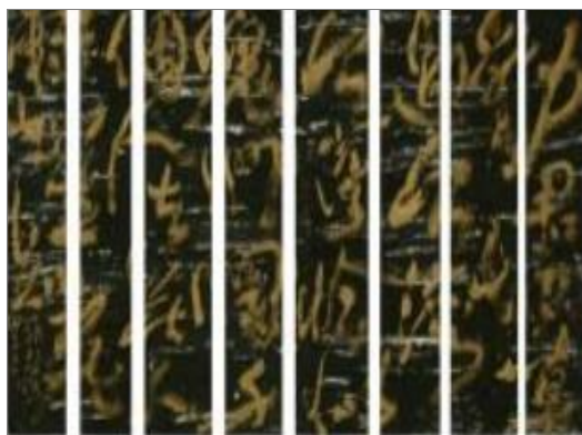
圖 5 《渡台悲歌》