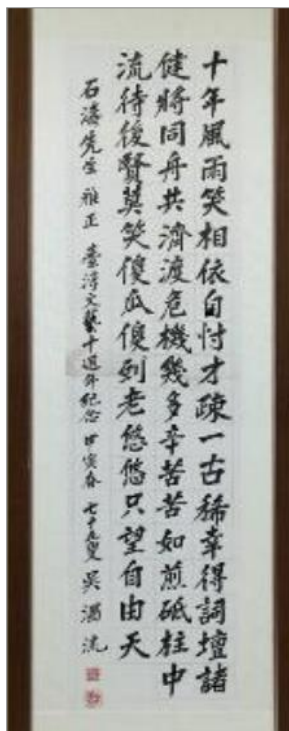
圖 2 《致贈葉石濤墨寶》