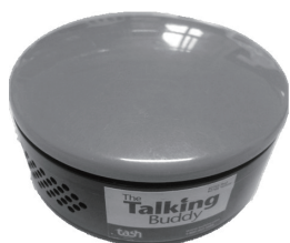
The Talking Buddy