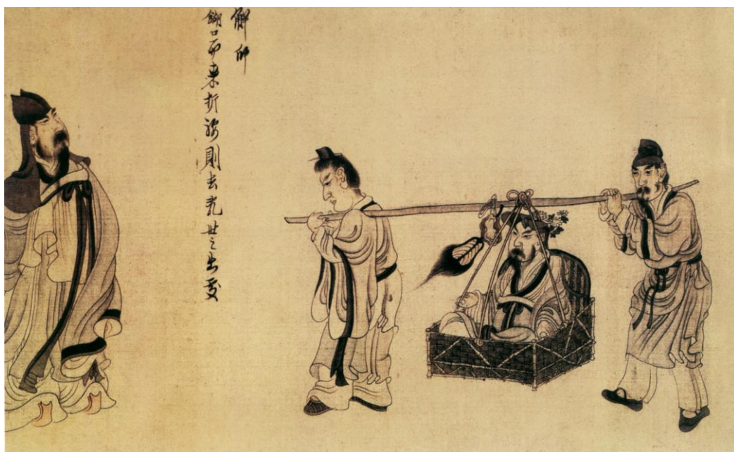
圖3 陶淵明故事圖（局部） 44

其時不少士人以死報效大明。此時的張岱且不為富貴畫畫，「尤喜為貧不得志人作畫，周其乏。凡貧士藉其生，數十百家。」若豪貴有勢力者索之，雖千金也不為搦筆。精於書畫文物的周亮工曾是張、陳兩人好友，但他明亡後擔任清朝官吏，張、陳都不與周相往來。陳洪綬特畫了一卷〈歸去來兮辭〉（圖3）相送，其中深意不言而喻。 43 好友續作畫；張岱續著書，能在家國沉痛中昇華文人氣節，其根源在知己的相扶持。