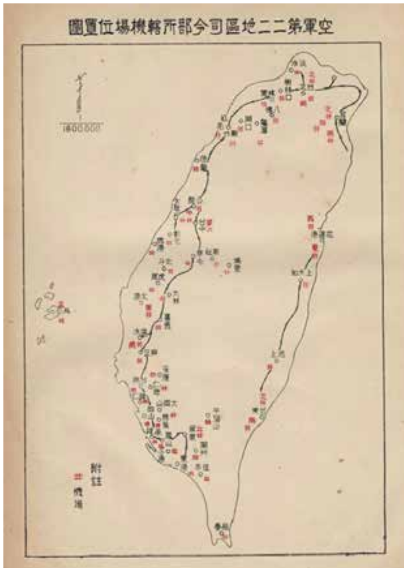
圖1、空軍第二十二地區司令部所轄機場位置圖