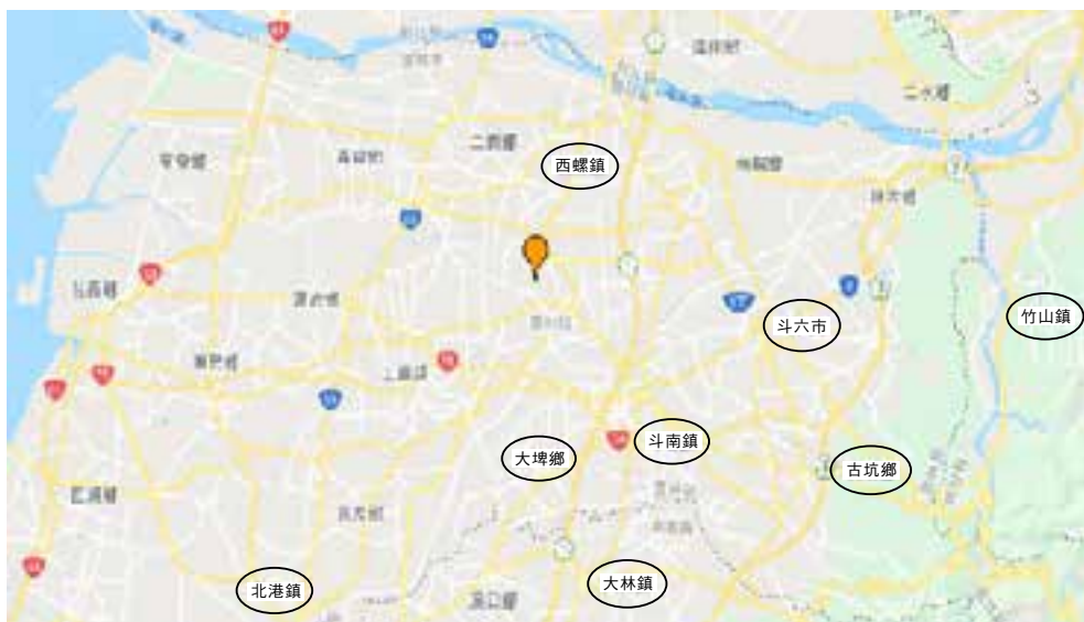
圖2、虎尾機場與主要支援鄉鎮位置圖