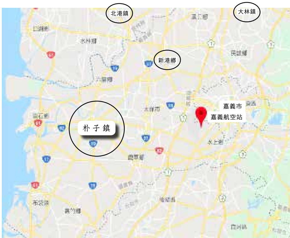
圖6、大林鎮、新港鄉、北港鎮及朴子鎮的相對位置圖

虎尾機場以南、嘉義水上機場附近，即涵蓋雲嘉中間地帶的鄉鎮區域——大林鎮、北港鎮、新港鄉、朴子鎮——可視為雲嘉南的多方支援中心，事件期間分別支援嘉義紅毛埤、水上機場與虎尾機場的圍攻行動。此區相較於其他地區更為活躍，其一是因地理位置臨近軍事要地，其二則是不同於上述鄉鎮內只有由鄉內社會青年與學生組成的一支向外支援隊伍，此區域的北港鎮、新港鎮與朴子鎮實際上有兩股民軍並進。