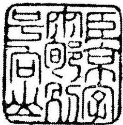
臣京字兩郇別號向山

鄧之誠亦言：「其時士者有文行者多入幕，調勝於仕異姓。」 83 周京的尺牘自稿卷三，集中記錄了他輾轉入幕時所從事的代筆之作，從中不易看出其對於入幕的態度，尤其是入滿族官員諾邁幕府。不過，清初遺民入滿族官員幕府並不鮮見，陸世儀（1611-1672）就曾在 1671 年冬至 1672 年初客江蘇巡撫瑪祜，魏際瑞（1620-1677）1677 年游南贛總兵哲爾肯幕。 84 而伴隨著清廷統治時間的推移，這些明末清初的文士對於新朝的態度也會發生變化。如周京對於入貲拜官者亦持寬容態度，「雖以貲奮迹，亦何損焉！」 85 惟當圖借徑實現立德立功而已；又《向山近鈔尺牘小品》兩集〈自序〉文末皆有「臣京字兩郇別號向山」之印章，這和好友石濤在康熙南巡時獻畫之署款有驚人的相似， 86 詳見下圖：