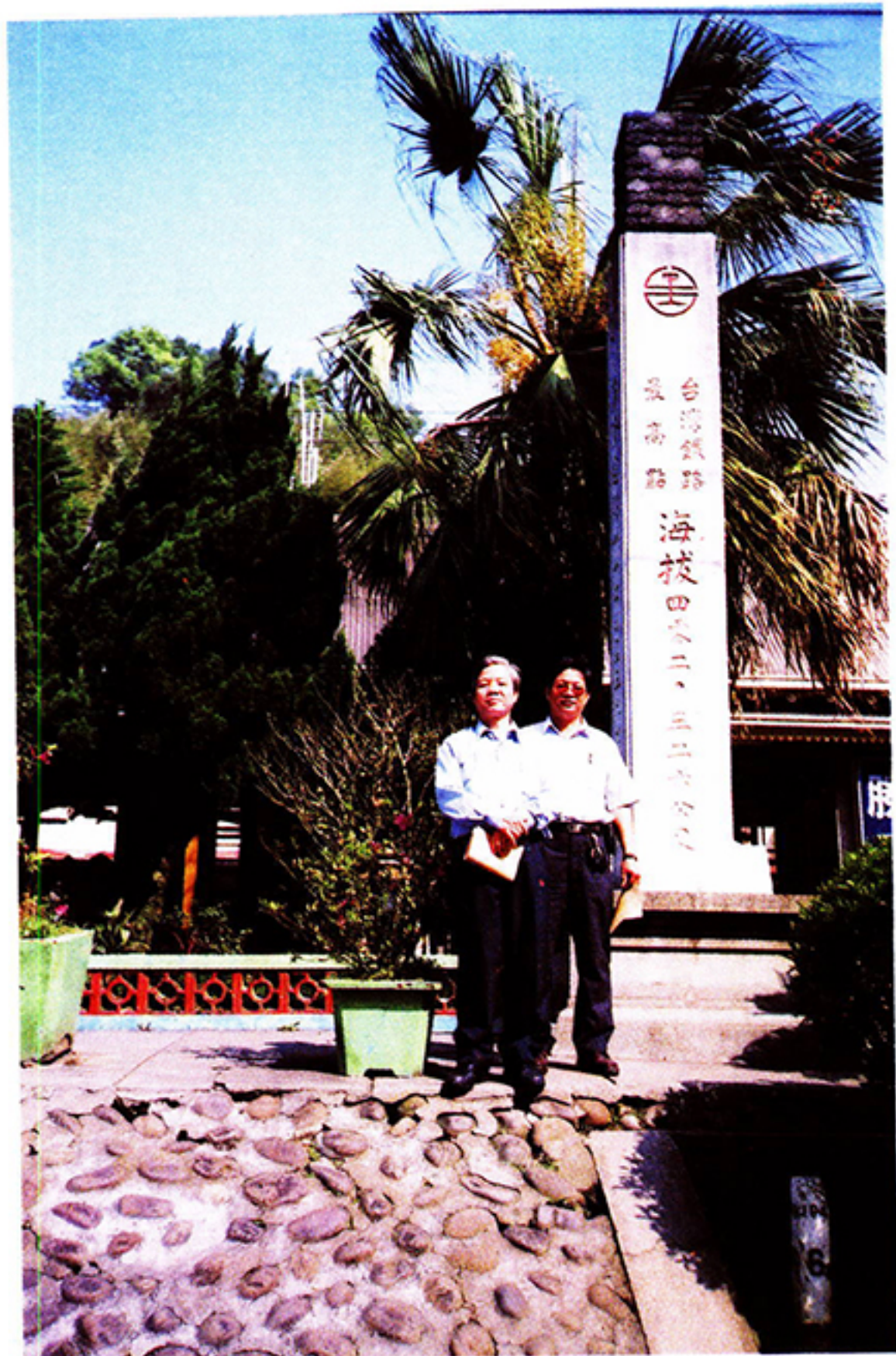
勝興站內的「台灣鐵路最高點」路標