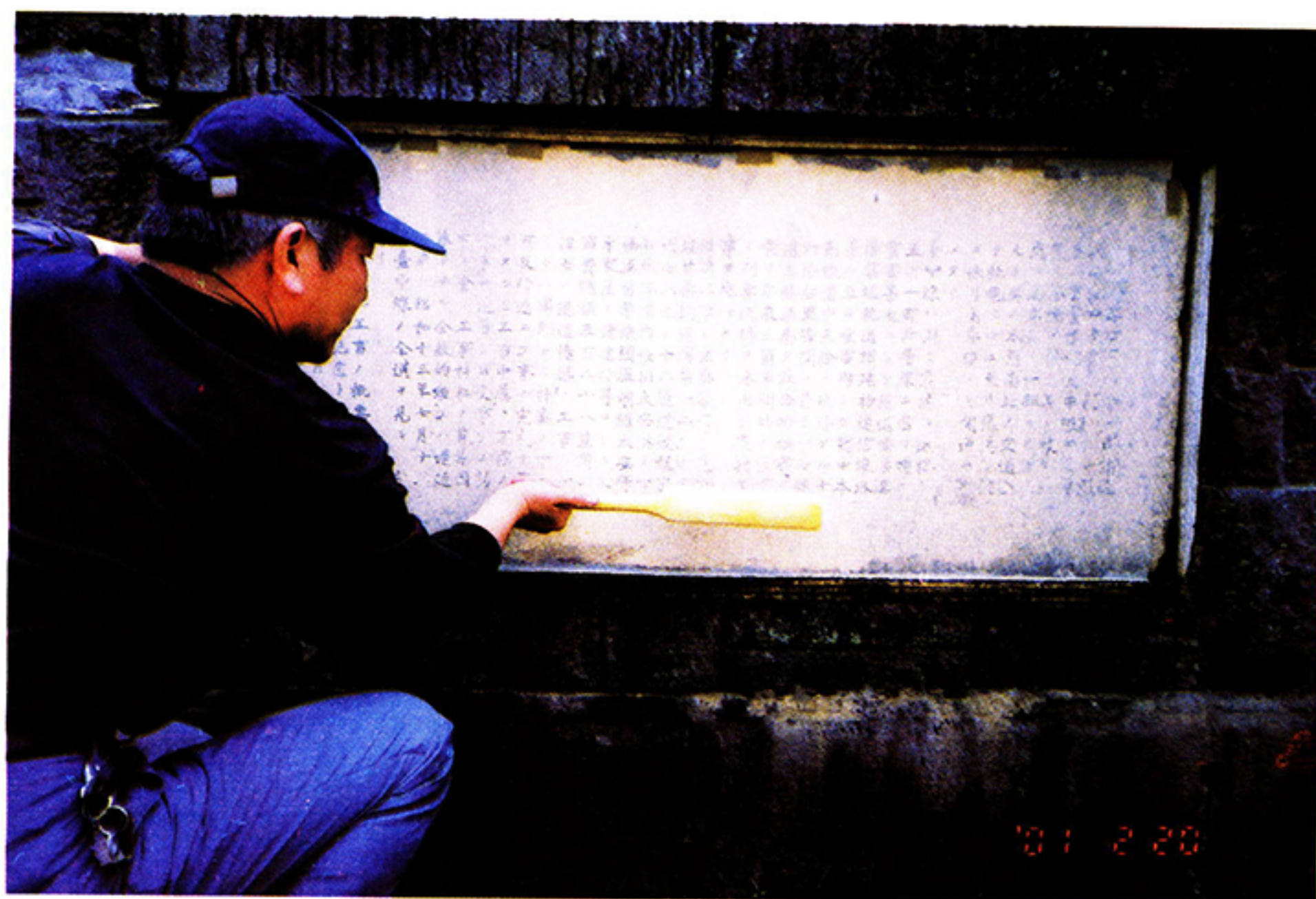
宣紙貼上碑面後以毛刷輕敲細打的情形