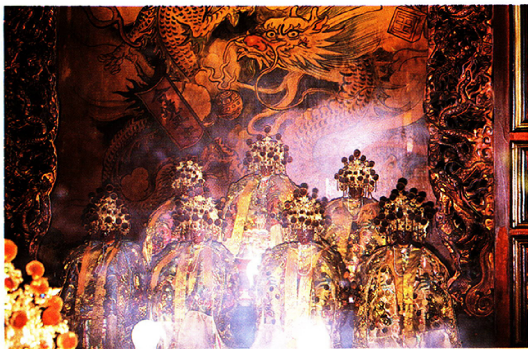
圖七：開隆宮主祀七星娘娘，可爲七也可爲一