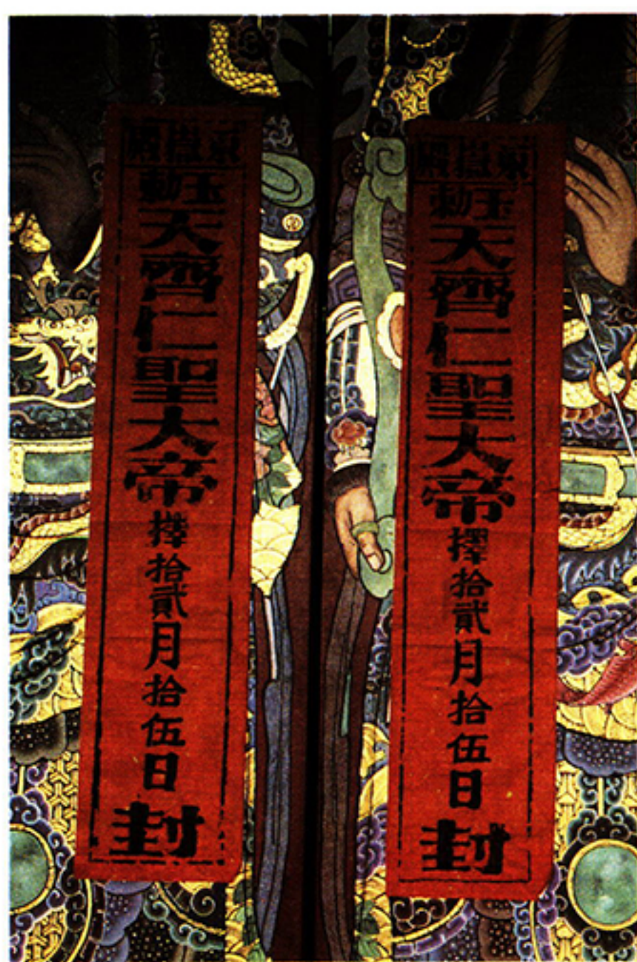
圖八：東嶽殿於農曆年底送神關廟門的情形