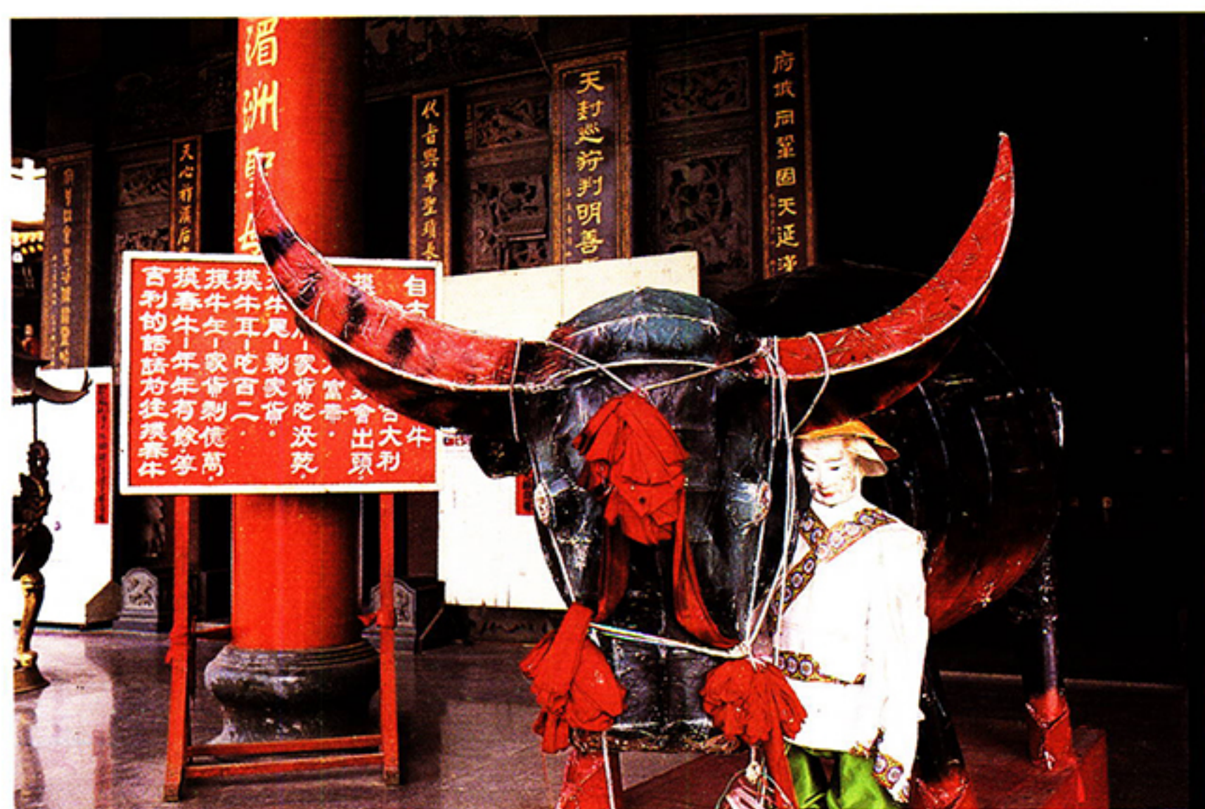
圖二：春牛由布紮成以供信眾撫摸