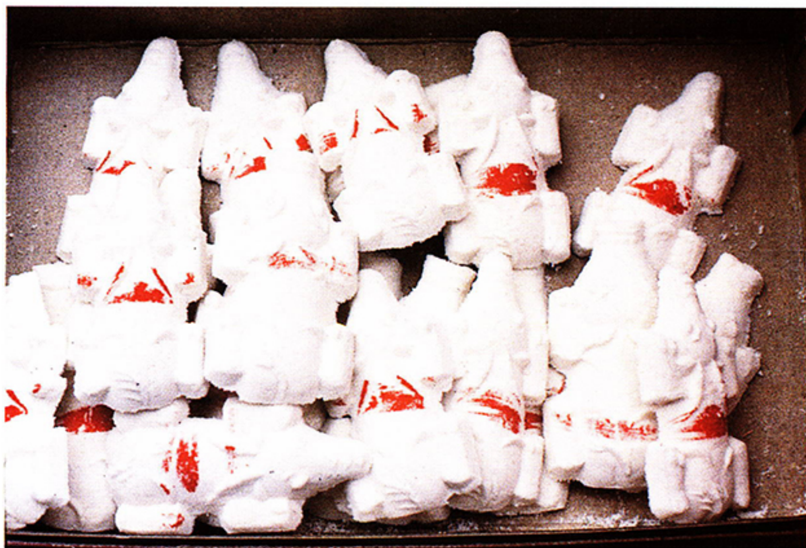
圖版四：綠豆糕製九豬十六羊，方嘴者豬、尖嘴者羊