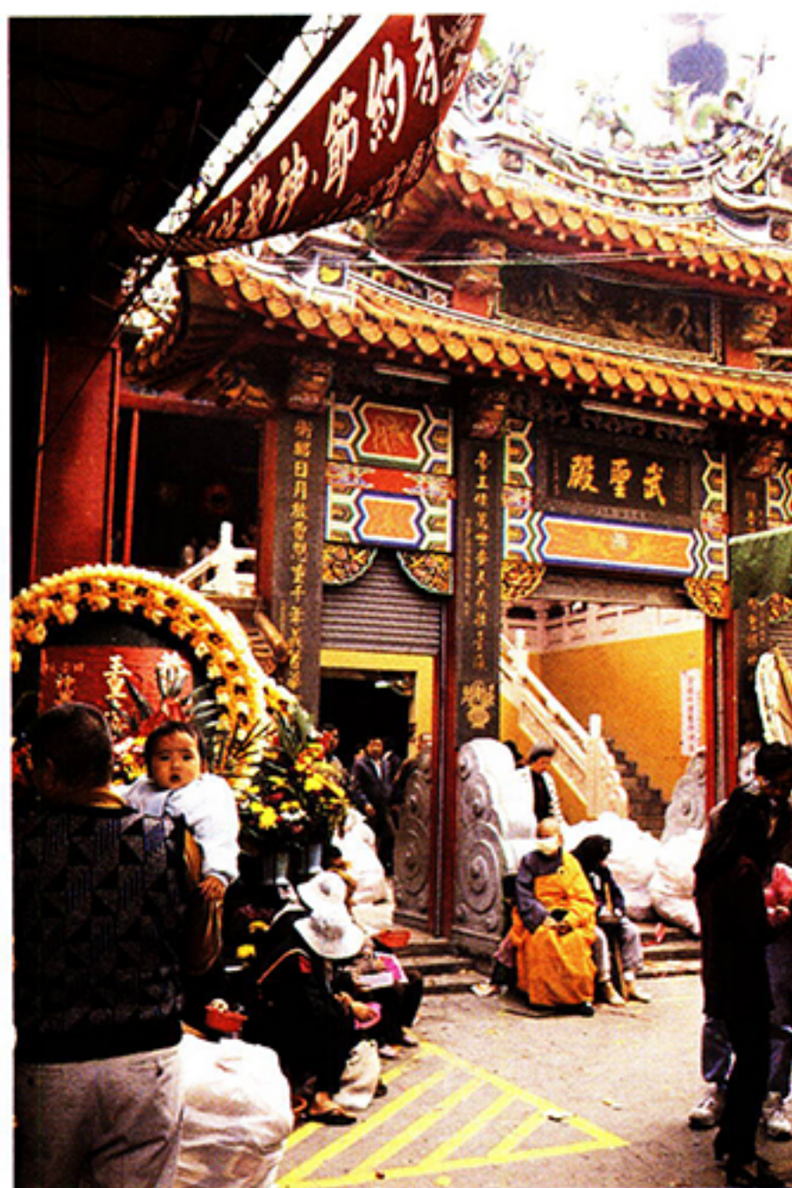
圖一：廟埕許多白布袋所裝皆是天公金