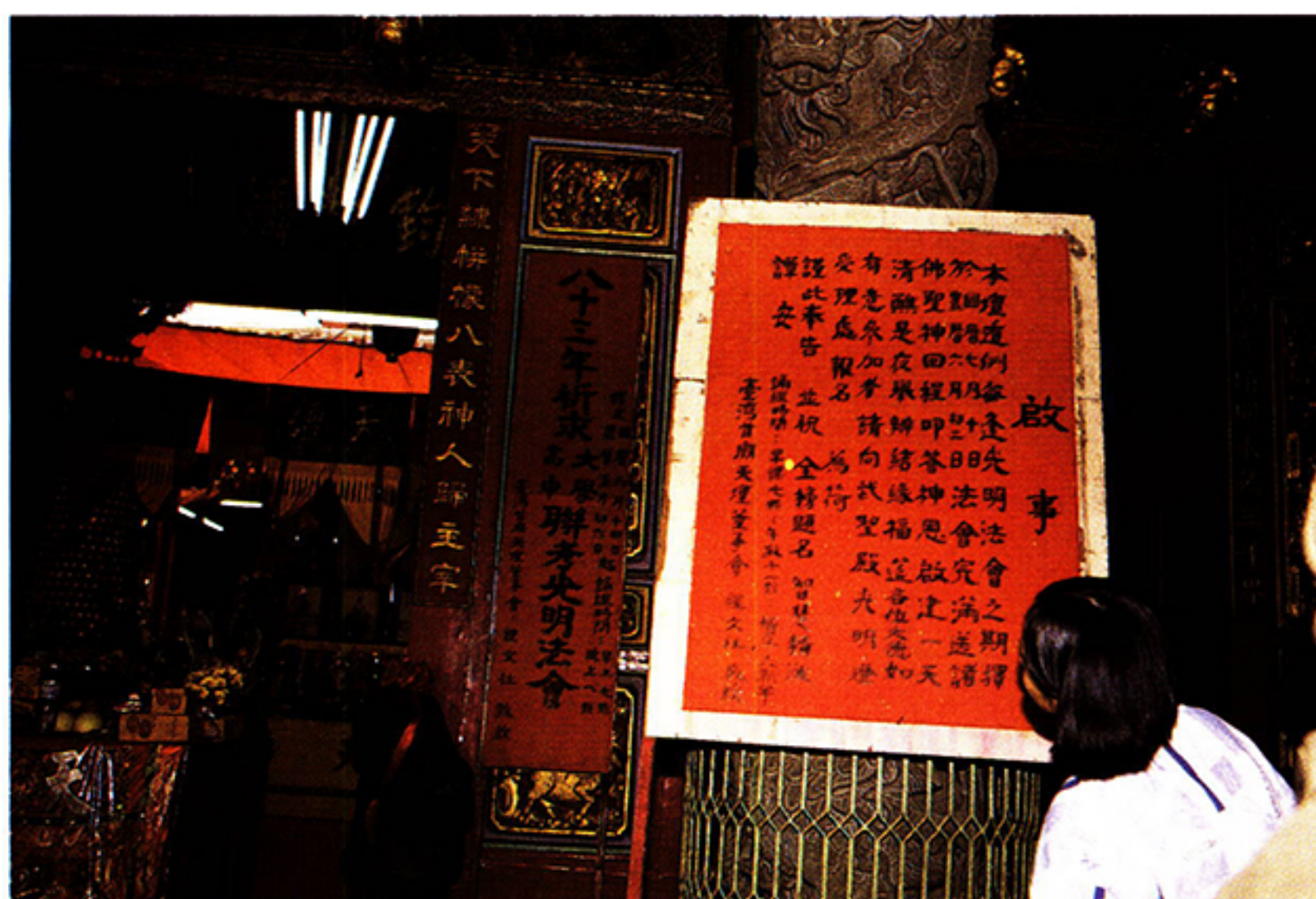
圖五：光明法會提供結緣福筵以服務考生