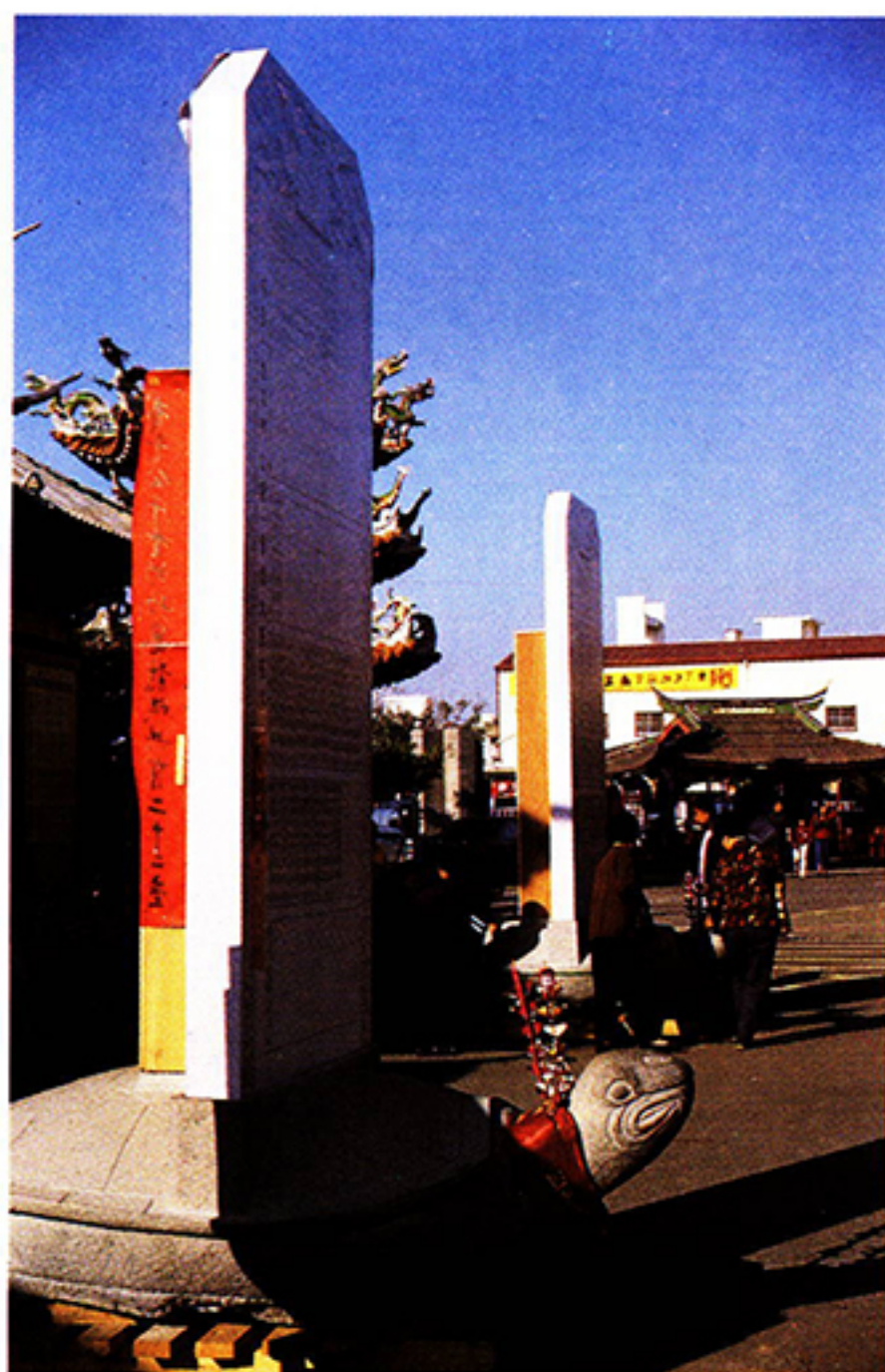
圖三：鼎廬馱碑形成摸龍龜的風俗