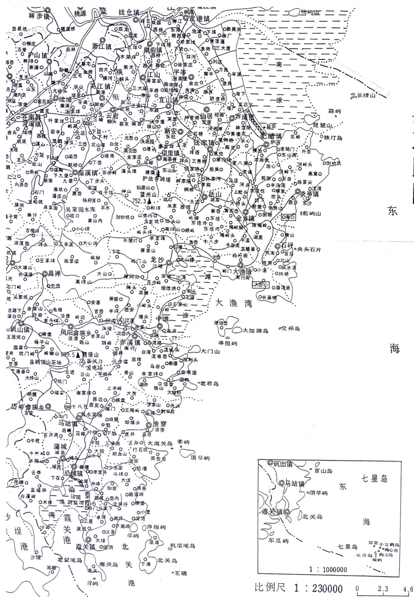
圖二 「海口」與「大礮心」