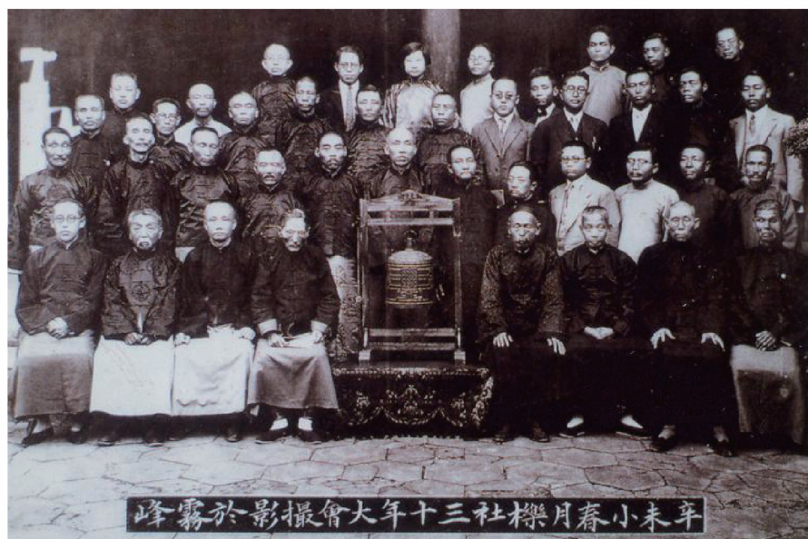
照片九 昭和6年（1931），11月22日下午二時標社三十週年大會合影 標社成立三十週年時鑄銅鐘紀念（銅鐘收藏於林獻堂文物館典藏）