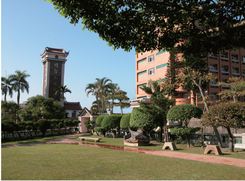
照片十四 明台高中美麗的校園與政光科技大樓