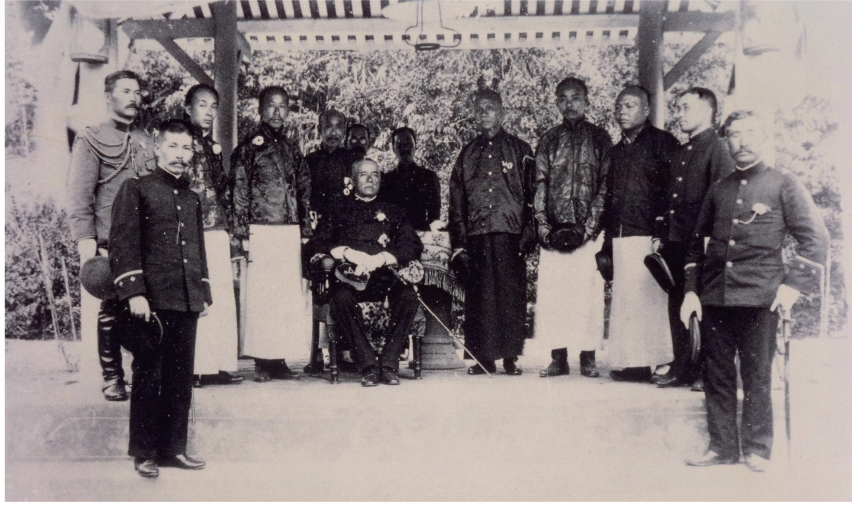
照片六 明治43年(1910)2月1日德國駐日大使坎撫男爵(中坐者)訪問林獻堂先生，並於萊園夕佳亭合影留念。(《台灣日日新報》漢文版記載：「德大使文霧男(爵)本(月)初一往阿罩霧林家」)