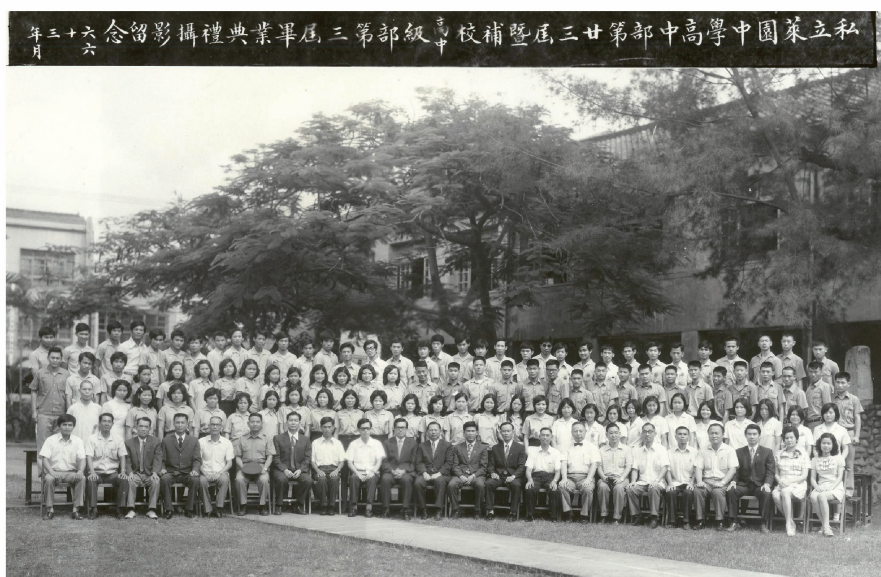
照片十三 民國六十三年萊園中學第二十三屆畢業典禮師生校園團體照