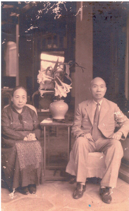
照片二 林獻堂先生與夫人楊水心女士合影