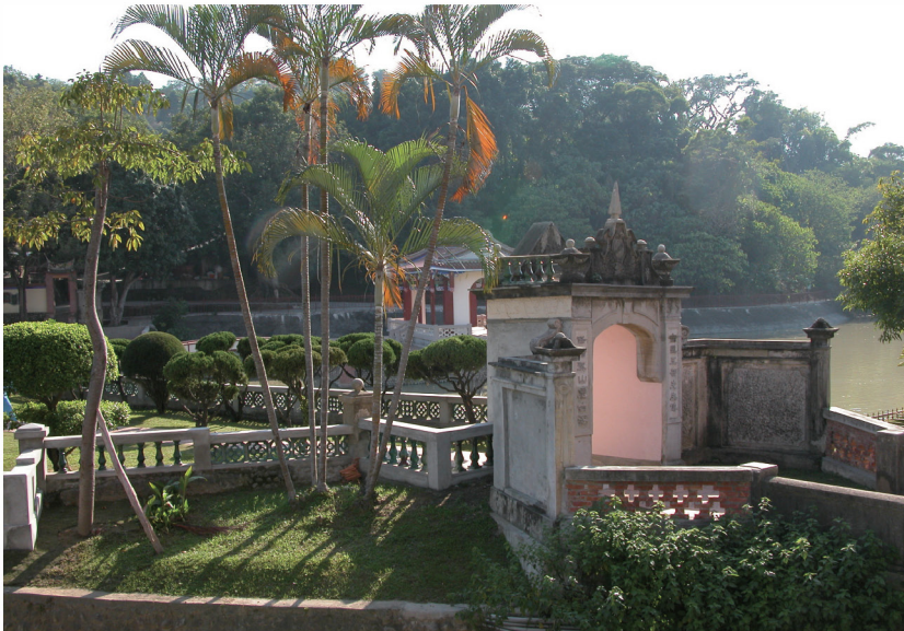
照片十五 明台高中校園文化古蹟(菜園)建於民國初年