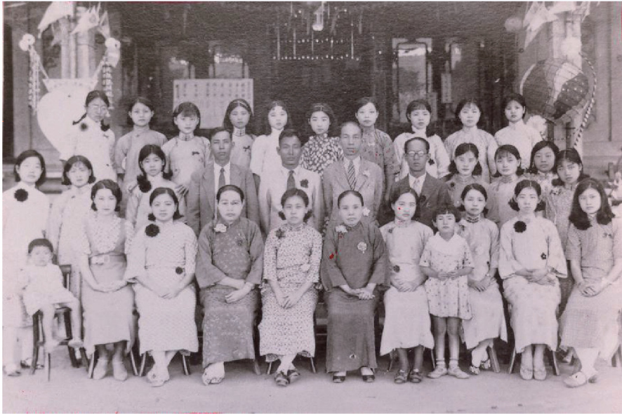
照片十 昭和7年（1932）一新會成立時會員於會館前合影