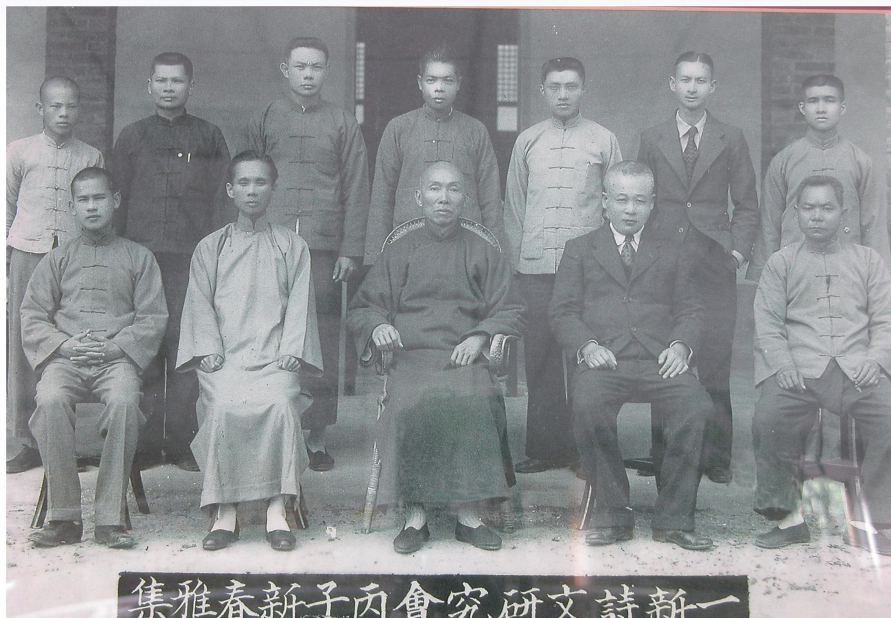
照片十二 昭和11年（1936）一新詩文研究會丙子新春雅集