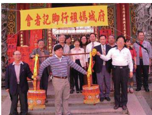
2005年『媽祖行腳』記者會（大天后宮前） 四廟代表與文資理事長、筆者