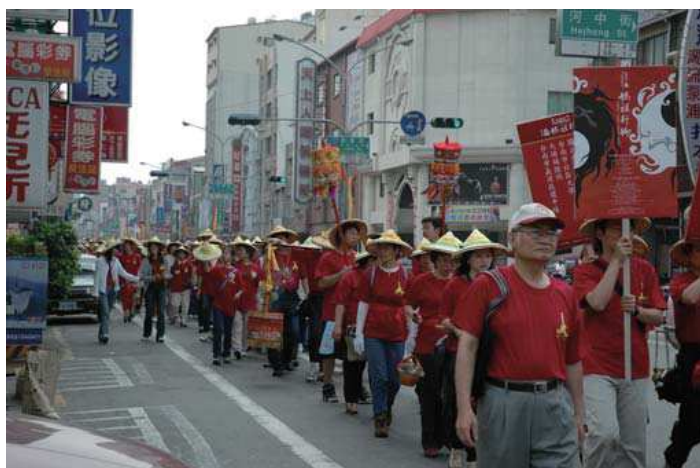
2005年4月2日『媽祖行腳』隊伍在街上之一景