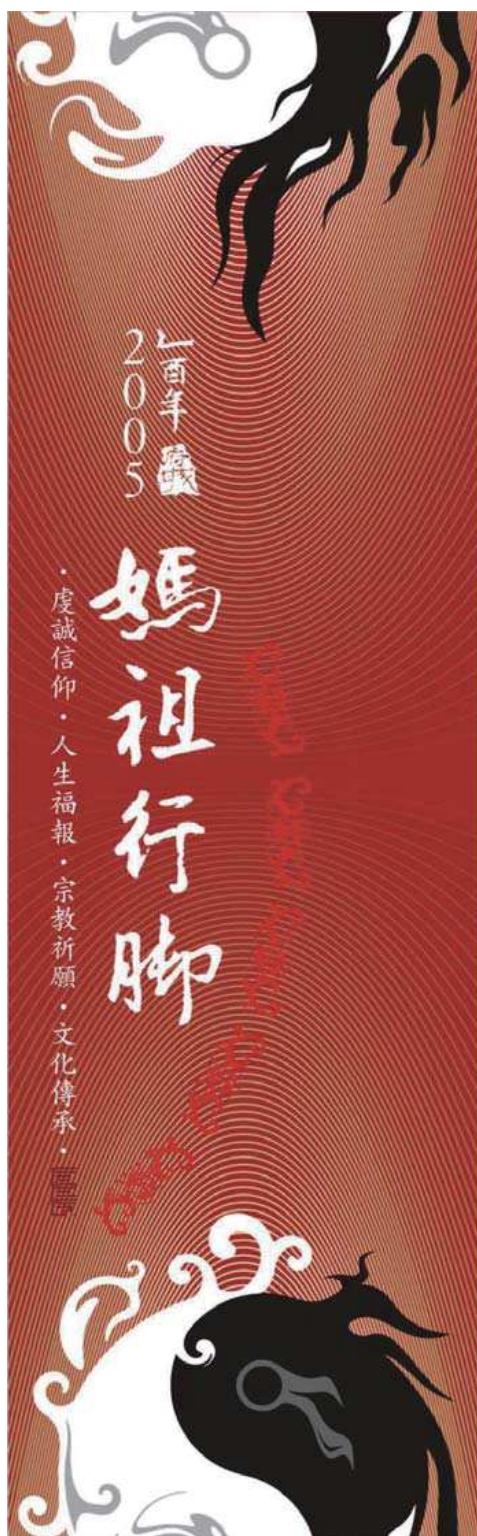
2005年『媽祖行腳』之所用保安卡