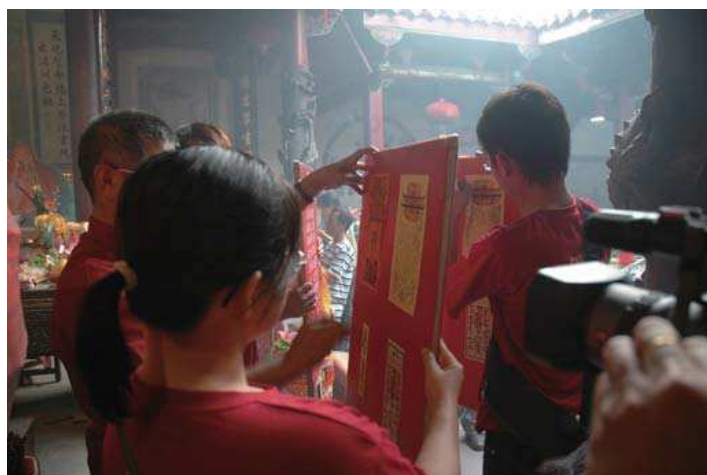
2005年4月24日『媽祖行腳』結束後在天后宮內拆香條儀式