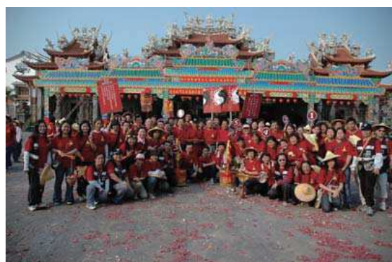
2005年4月24日『媽祖行腳』隊伍在鹿耳門天后宮合影