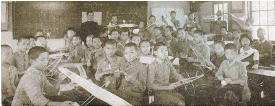
圖二、1942年台中州員林郡溪湖國民學校「模型航空機」課程教授