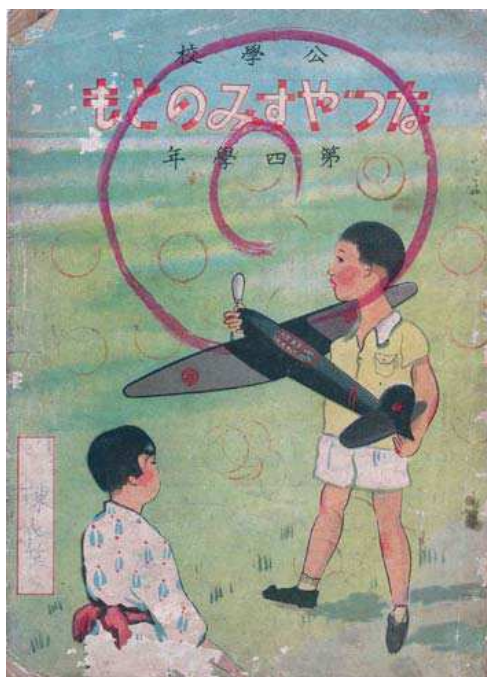
圖三、1938年公學校「なつやすみのとも」（暑假作業）封面

此外，學生的暑假作業內容中也包含不少「航空相關」的課題。以1938公學校第四學年的「なつやすみのとも」（暑假作業）為例，封面就是一幅男女學童在空地玩模型飛機的彩色圖案，而在內容方面就有7月17號的「飛行機」中關於飛機與戰爭的韻文（頁8）、7月26日的「口話」（說話課）中關於在海上看到飛機的故事（頁17）及8月22日的「空の勇士」（空中勇士）中講述海軍航空隊古賀兵曹在中國南京英勇奮戰的事蹟（頁48）。 16