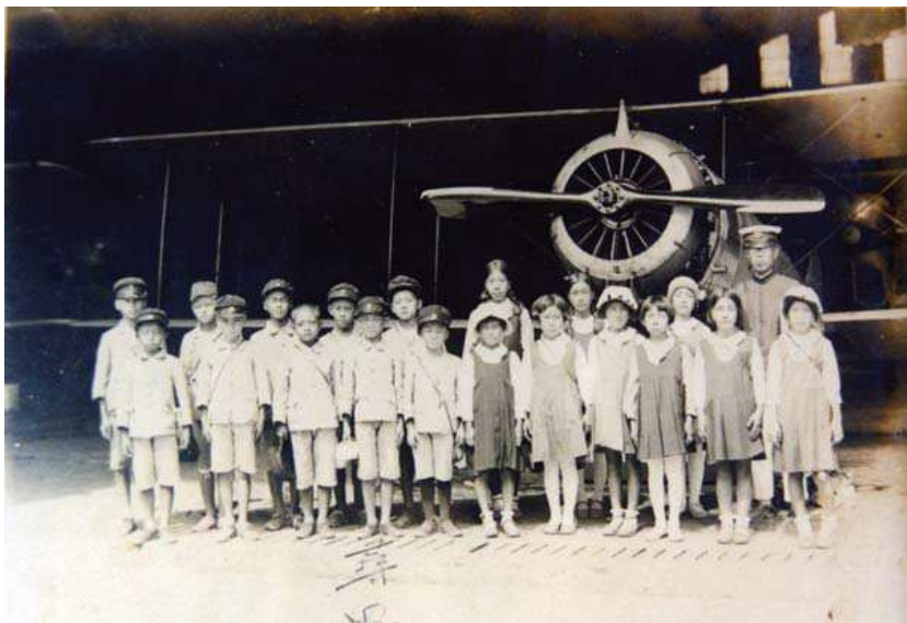
圖六、1931年彰化二水尋常小學校學生參觀屏東飛行場