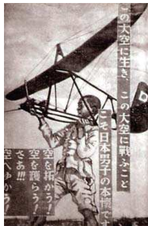
圖九、1940年代台灣「航空日」紀念戳章及海報