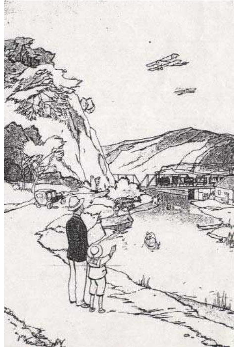
圖一、（左）1941年公學校國語科中「模型飛機」課程內容教授； （右）1937年公學校國語讀本內容中的飛機圖片介紹

資料來源：（左）島嶼柿子文化館，《台灣小學世紀風華》（台北：柿子文化，2004年），頁32。