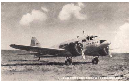
圖七、台灣學校學生相關「獻納飛行機」：（上）1934年陸軍愛國116號「台灣學校號」；（左）1944年陸軍愛國2536號「台北市學校號」；（右）1940年「台灣義勇學校第二號」