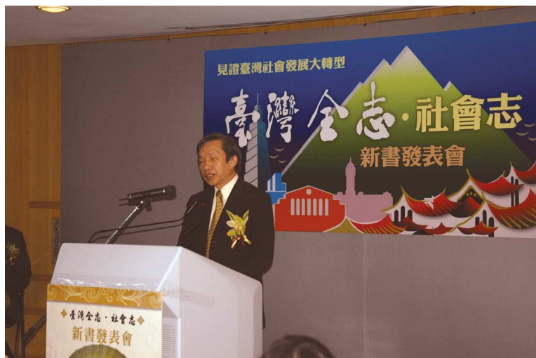
臺灣全志社會志新書發表

述訪查、專史通論等之外，更與行政院原住民族委員會、客家委員會合作，進行「台灣原住民史」、「台灣客家族群史」的纂修工作，呈現台灣多族群文化的內涵。