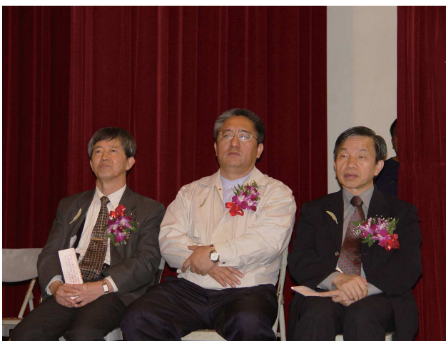
七腳川新書發表會花蓮縣