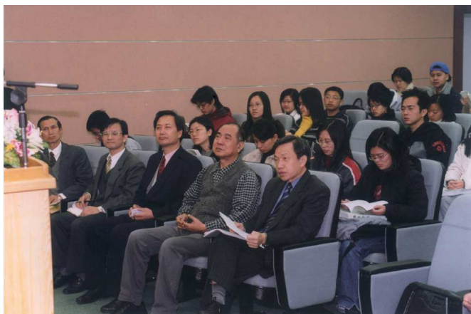
92年暑期台灣史研習營