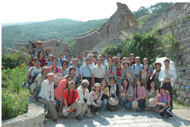
95年馬祖文化研習芹壁村