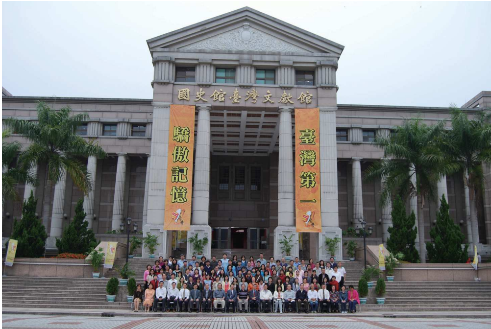
970224國史館全體同仁合照