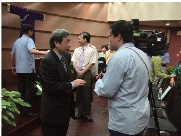
發現客家新書發表會