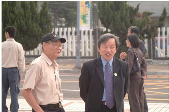
950301參加烽火歲月-戰時體制的台灣史料特展