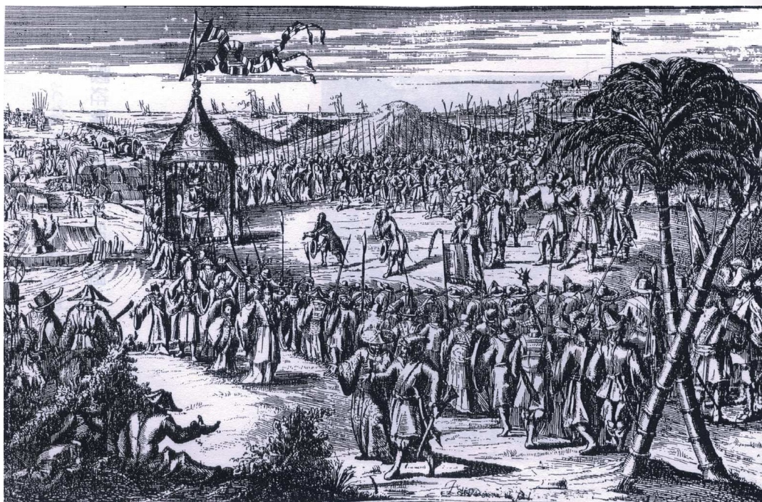
圖1、國姓諭普羅民遮城代表梅腓力限期投降圖

街三老爺碑記自註』一文 5 ，以『主神三老爺事蹟，僅知是朱、雷、殷三王爺，其中朱王爺又稱蕭子揚。而朱王爺是由歸仁大人廟分香，蕭壠金唐殿則由本廟分香等線索而已。此等史料仍無法了解三老爺之來歷，僅得借助於其他供奉三老爺，而建於鄭氏或康雍乾三朝寺廟耆宿之口碑，以從旁推敲。』