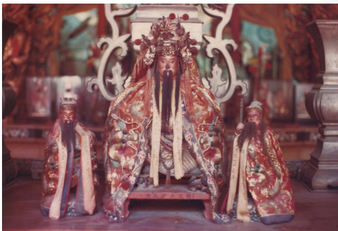
圖2、安平天后宮所祀國姓塑像，原祀於王城

袍人出見，署故空。』 13 此鬼魂衣紅袍，在明制朝服為紅袍者唯親王、郡王，即王爺而已，居王城之王爺僅國姓爺一人，故疑即國姓英魂。因之，官民以國姓英魂尚存，在國姓謝世時，即雕塑國姓神像，供奉於王城。鄭氏覆滅後移奉安平天后宮，今仍在安平天后宮，為官民視國姓為神祇之始（附圖2）。