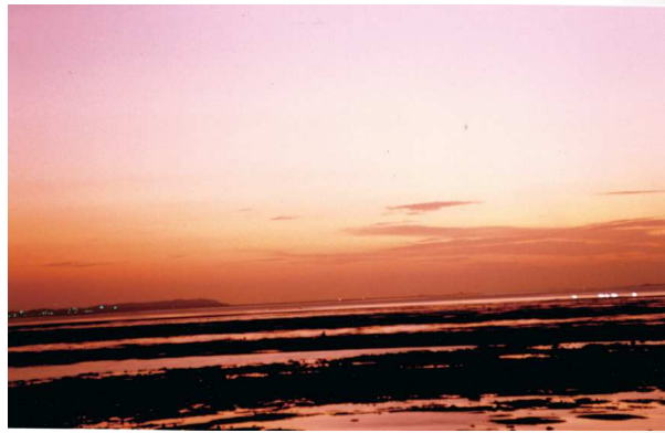
圖10、澎湖縣白沙鄉中屯橋：丹霞一縷裊彭津

此詩所表現之情感比道光時期之作品更深刻。丘逢甲，祖籍嘉應鎮平（今廣東蕉嶺），生於臺灣苗栗，二十六歲中進士。中日戰爭後，集鄉民而訓練，以備戰守。馬關條約簽訂後，與士子陳季同謀思建民主國以抗日。 67 此詩雖仍用了