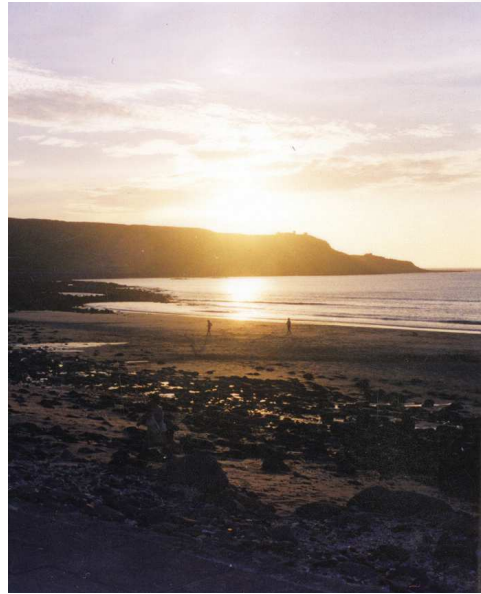
圖7、澎湖縣西嶼鄉內垵村後灣：斜暉映水吐金光

此詩將落霞豐富之光影變化，描繪得淋漓盡致。起句「斜暉映水吐金光」，展現的是輝煌的氣勢，與乾隆朝的國勢是相稱的。而「五色紛綸遍大荒」、「紅綃幙罩水雲鄉，乍疑赤壁餘荒壘」句中讀出至乾隆朝，臺灣入滿清版圖已五十多載，然在詩人眼中澎湖仍是「大荒」、「荒壘」之域。而此大荒之地遍滿五色紛綸，非僅西嶼一區有彩霞，連花嶼、草嶼亦是錦繡文披。皇恩廣被，光輝瀾蓋蠻