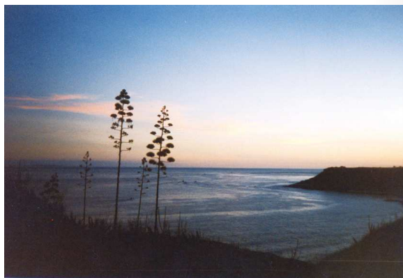
圖4、澎湖縣西嶼鄉內垵村萬善宮旁：霞染瓊麻成火樹

每一句都是晚霞照射下不同變化的描寫，八句共同揮灑出天邊五彩繽紛的落霞，詩意既不重複，也不累贅。詩中善用譬喻，有紫金色的沙灘、火燃燒般的樹叢，錦鍛似的田間小道，和天女散花下的天空，展現這神祕國土。而前六句的蘊釀，為的是要在尾聯登高一