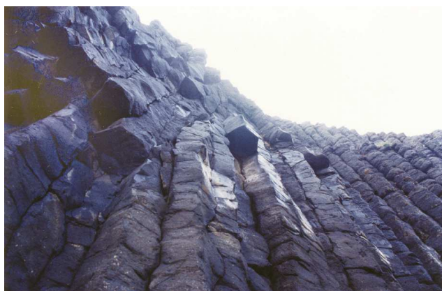
圖3、澎湖縣西嶼鄉大池村海灣：接天玄武恍折珪

此詩就西嶼落霞周邊之地理環境書寫，然澎湖實無所謂的重山峻嶺，更無所謂的「水盡山橫峙」；因東北季風強盛，亦無所謂的樹。這樣的書寫模式，實屬大陸文化特有的思維模式。由此也見到中原文化「模山範水」的美學觀移植臺灣的