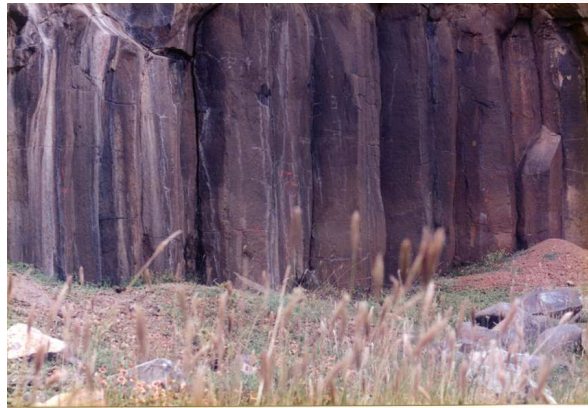
圖9、澎湖縣西嶼鄉內垵村後灣：熾爛光射丹崖上

此詩所表現之情感比道光時期之作品更深刻。丘逢甲，祖籍嘉應鎮平（今廣東蕉嶺），生於臺灣苗栗，二十六歲中進士。中日戰爭後，集鄉民而訓練，以備戰守。馬關條約簽訂後，與士子陳季同謀思建民主國以抗日。 67 此詩雖仍用了