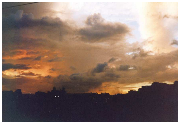
圖6、澎湖縣西嶼鄉內垵村後灣：宋車魯馬更離奇，界畫雲烟李伯時

余文儀，乾隆25年（1760）任臺灣道，乾隆27年（1762）任海防同知，乾隆29年（1764）任臺灣道，乾隆36年（1771）任巡撫。此詩最大特色在於善用譬喻，具象生動。頸聯以春秋戰國時宋國馬車之華麗，魯國戰馬之雄壯比擬雲彩，展現西