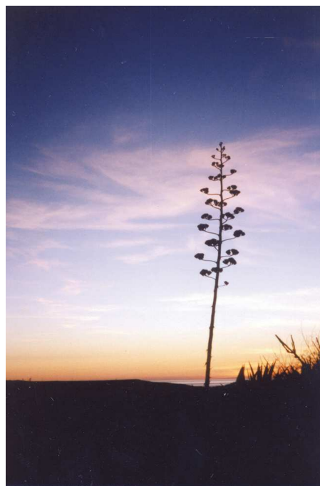
圖1、澎湖縣西嶼鄉內垵村後灣：明霞散天末，灼灼濃於綺

明霞散天末，灼灼濃於綺。 試吟謝眺詩，分明擬得似。 遠看孤嶼間，疑自赤城起。 何當遇劉郎，與之同徙倚。