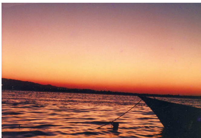
圖5、澎湖縣西嶼鄉內垵村後灣：落霞未落正流輝，海邊漁火將藏餌

詩中所表現的亦是西嶼邊境的蒼茫渺遠。從詩句「西望澎湖杳無極，奇峯羅列映斜暉」很清楚得知此詩是在一股「臺灣八景詩」創作風潮下的產物，非為作者親睹西嶼落霞之作，因為澎湖是平臺地形，並無奇峯。「奇峯羅