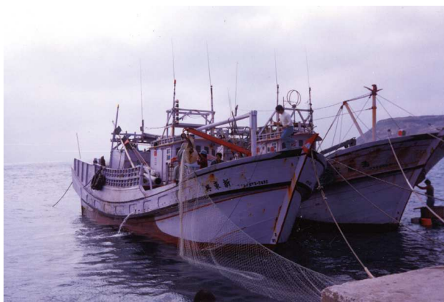
圖8、澎湖縣西嶼鄉內垵村港灣：輕艘穩渡擬丹梯

此詩與康、乾時期的風格不同，雖亦用到「綺布」、「五彩」、「霓」、「丹梯」等多彩的字眼，但是「遙瞻暮靄添詩思，好把雲箋綵筆題」，詩趣趨於平靜、溫和。但從詩之用詞——「孤鶩」，亦見臺灣詩學深受中原文化影響。再看道光年間劉伯琛的詩：