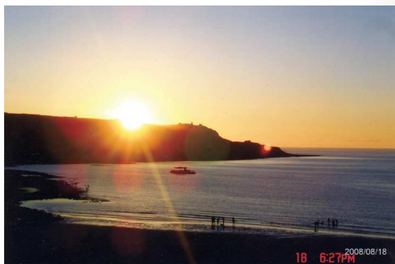
圖2、澎湖縣西嶼鄉內垵村後灣：夕照西山尚未昏，遊客徘徊不忍去

「西山」、「倒影」、「痕」、「風飄草木」、「殘紅」、「晚村」，蕭條、孱弱字眼占滿詩篇，整首詩未見高氏、齊氏之滂薄絢麗，只見孤寂。這些受遣來臺的文人仕宦，或是文官、或是武將，秉著皇恩，守土護國，一則心存感戴，一則遠離朝廷、故鄉，