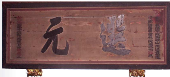
圖一、卓肇昌「選元」匾