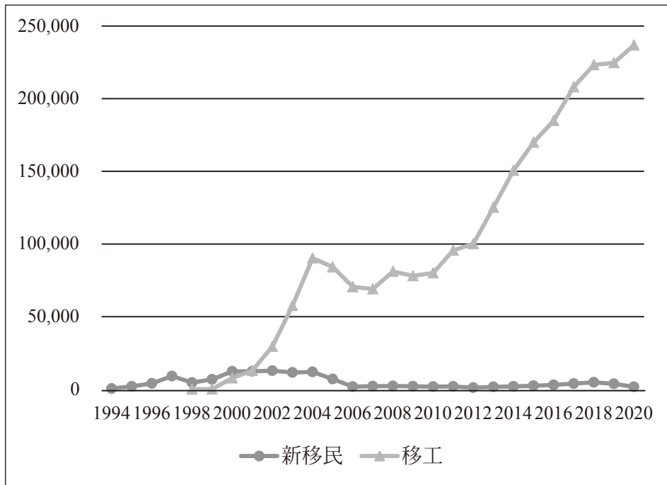
圖1 在台越南移工與新移民歷年人數