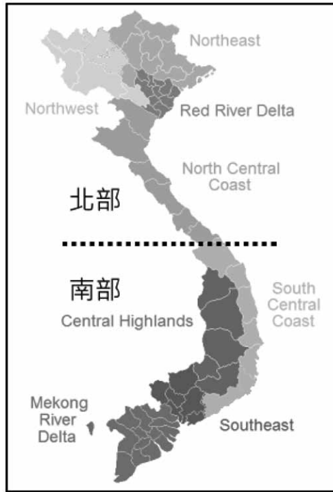
圖4 越南之經濟地理分區圖