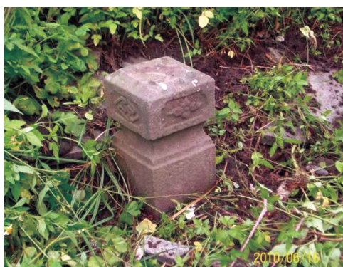
圖21 「皇清例贈太安人諡淑慈林媽黃氏佳瑩」所立石印短柱。