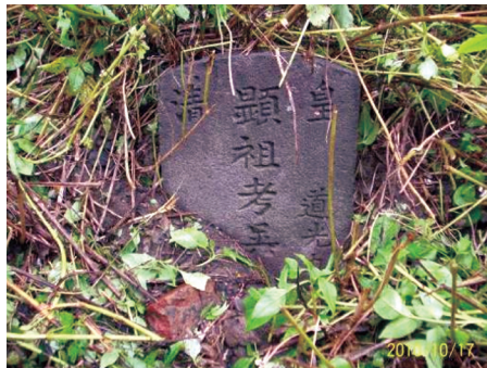
圖35 遭土掩埋的「皇清顯祖考吳公之墓」。