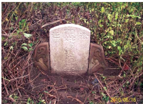
圖8 光緒13年「顯妣諡絲綸董媽林氏墓」。