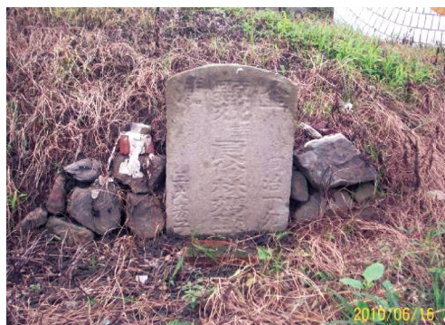
圖16 同治6年「顯妣諡良儉林媽藍氏墓」。