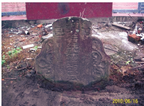
圖9 光緒9年「顯考純德胡公墓」。

「全石土墓」者，所立墓碑仿「古體土墓」三合碑式樣，使用1塊完整的石板打造而成，碑心與碑翼一體成形，而非由3塊石板拼湊成形，此類型的古墓，形制體積較一般古體土墓來的袖珍。 10 公墓內一共發掘了「全石土墓」3門，分別為光緒9年「顯考純德胡公墓」、光緒14年「皇清顯考諡方正吳公之坟墓」和光緒17年「顯考名杏劉公墓」。