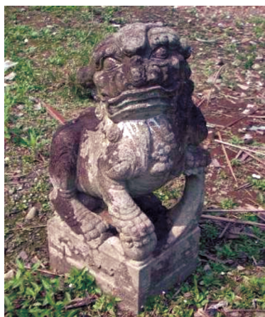
圖27 林桐直墓中的石獅（左）