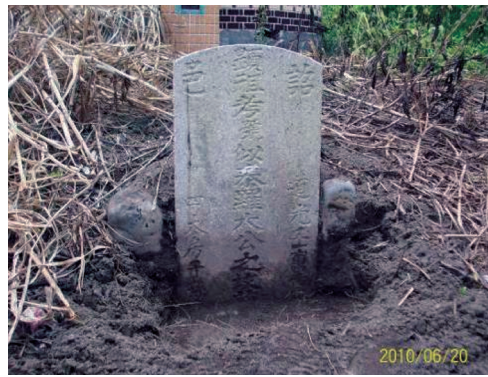
圖14 道光22年「顯祖考號似泰羅大公之墳墓」。