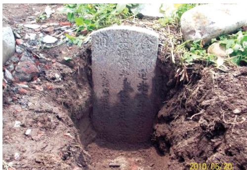
圖12 道光6年「皇清顯考諡信善吳公之墓」。

「碑心式古墓」為筆者就「古體古墓」、「全石古墓」及「金形古墓」 11 以外不同類型古墓所作的命名。這種類型的古墓，在墓碑外觀的呈現上，與「古體古墓」及「全石古墓」有著顯著的不同，其最大的差別處便是墓碑的表現方式。「碑心式古墓」墓碑外觀極為簡單，僅使用1塊長方形石板打造碑心（墓碑），碑心左右兩側並不施作碑翼（墓碑兩側墓肩石）。除此以外，「碑心式古墓」亦不模仿「全石古墓」一體成形的墓碑式樣，少有工藝技法的表現。此種類型的古墓，公墓內共發掘7門，分別為道光6年「皇清顯考諡信善吳公之墓」、道光9年「皇清顯祖考吳公之墓」、道光22年「顯祖考號似泰羅大公之墳墓」、同治6年「顯妣諡良順林媽黃氏墓」、同治6年「顯妣諡良儉林媽藍氏墓」、同治年間「顯考口楊公之墓」、光緒6年「顯妣諡貞列吳媽潘氏之墳墓」。