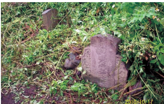
圖34 未整理前之「顯妣諡貞列吳媽潘氏之坟墓」（左）與「皇清顯考諡方正吳公之坟墓」（右）。