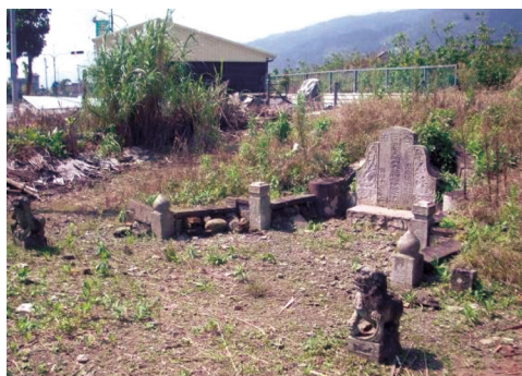
圖33 光緒4年「皇清例授奉政大夫諡桐直林公之佳城」，墓中珍貴石雕構件多已失竊。