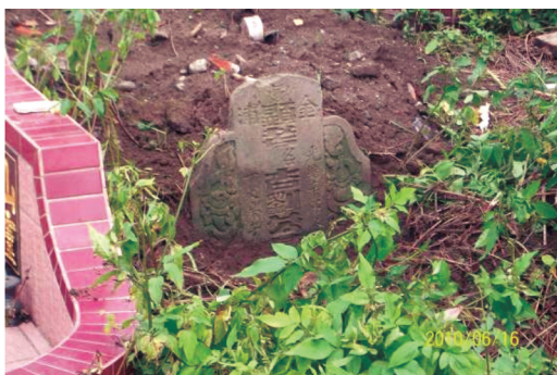
圖32 已失祭的光緒17年「顯考名杏劉公墓」。