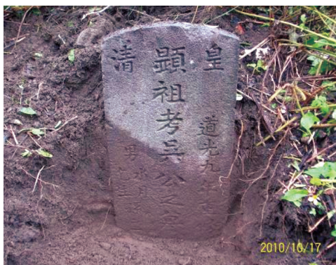
圖13 道光9年「皇清顯祖考吳公之墓」。