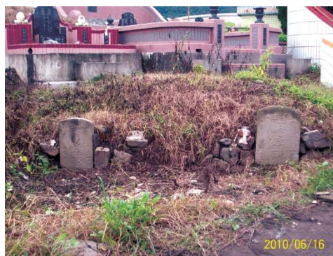
圖31 同治6年「顯妣諡良順林媽黃氏墓」及「顯妣諡良儉林媽藍氏墓」比鄰而建。