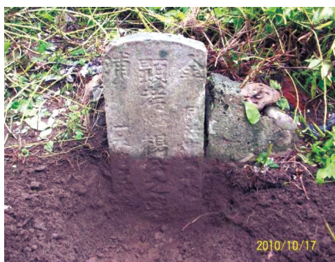
圖17 同治年間「顯考□楊公之墓」