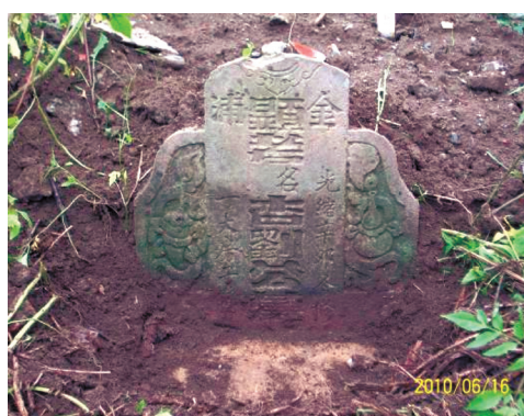
圖11 光緒17年「顯考名杏劉公墓」。