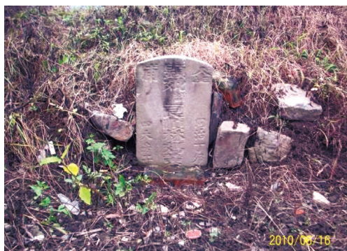
圖15 同治6年「顯妣諡良順林媽黃氏墓」。