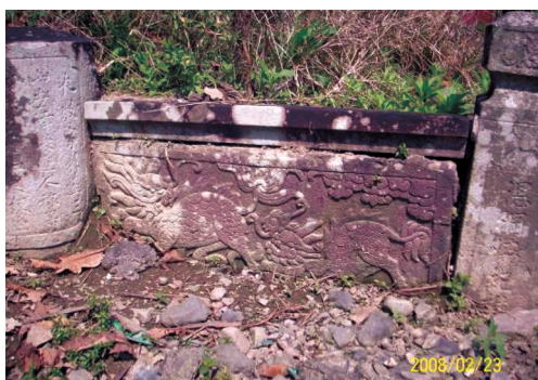
圖28 林桐直墓中雕刻精美的麒麟曲手堵。