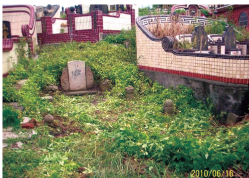
圖23 「皇清例贈太安人諡淑慈林媽黃氏佳瑩」全景。