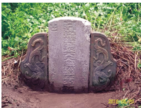
圖7 光緒7年「皇清誥授奉政大夫諡誠□林公之坟」。