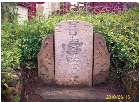
圖19 光緒元年「皇清例贈太安人諡淑慈林媽黃氏佳瑩」。