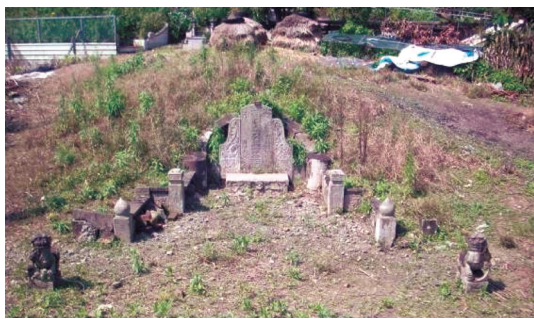
圖6 光緒4年「皇清例授奉政大夫諡桐直林公之佳城」。