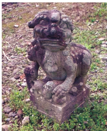
圖26 林桐直墓中的石獅（右）