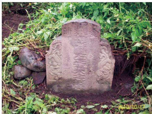
圖10 光緒14年「皇清顯考諡方正吳公之坟墓」。