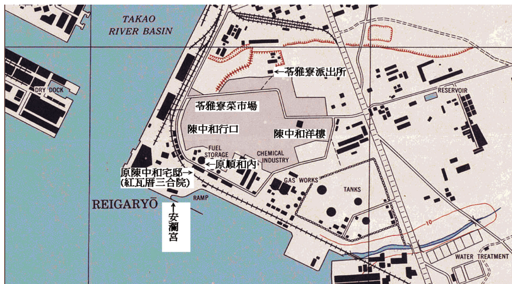
圖1 昭和19年（1944年），「順和棧」因建油庫（Fuel Storage）遭拆毀；其對街西邊即為紅瓦厝三合院的「陳中和宅邸」。

同治9年（1870年），陳福謙設「順和棧」於苓雅寮；比鄰另建有一廣大的宅邸，作為「順和行」辦公室，當地居民都叫「順和內」。 3 日治末期，「順和棧」遭徵收、拆除，改建為油庫，只剩「順和行」（如圖一）；其緊鄰對街西邊即為紅瓦厝三合院的「陳中和宅邸」。 4 （圖二）