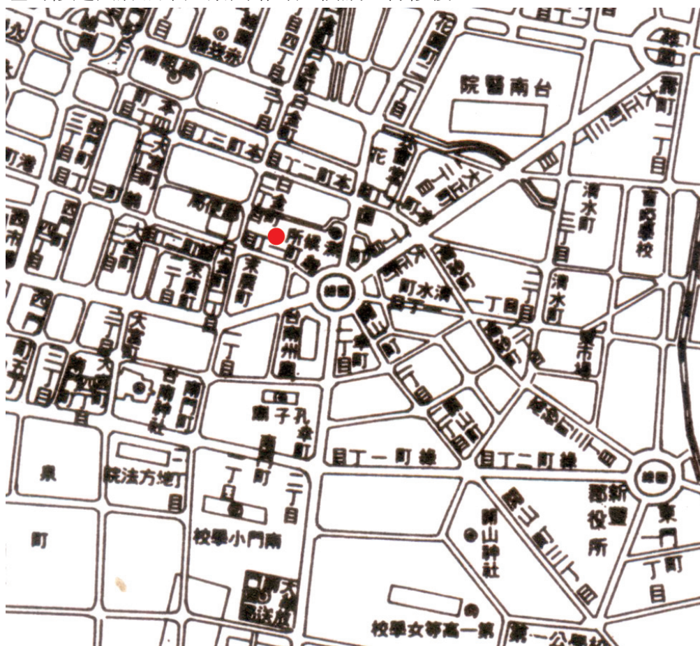
來源：紅點為天壇所在位置。李明賢撰述，《臺灣地名辭書》，卷廿一・臺南市，頁 27 - 28。