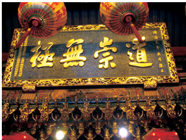
圖一 臺澎兵備道洪毓琛獻「道崇無極」匾

另外，同治元年（1862年）臺澎兵備道洪毓琛獻「道崇無極」、同治3年（1864年）福建臺灣水師副將葉晞陽獻「洪鈞鼓鑄」、光緒11年（1885年）臺灣鎮總兵章高元獻「赫濯聲靈」、光緒16年（1890年）基隆同知權臺南知府方祖蔭分別獻上「主宰元樞、三才弑理」 10 ，可以看出當時官紳投入天壇興建的狀況。