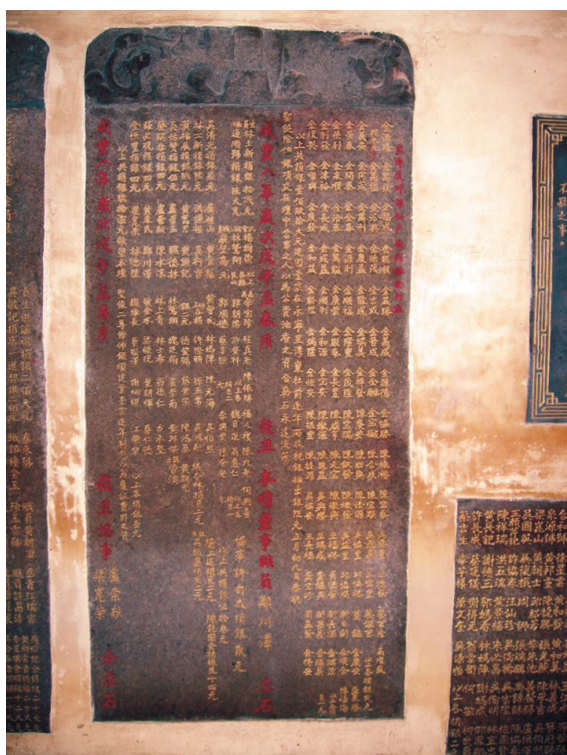
圖六 臺郡天公壇捐緣碑記