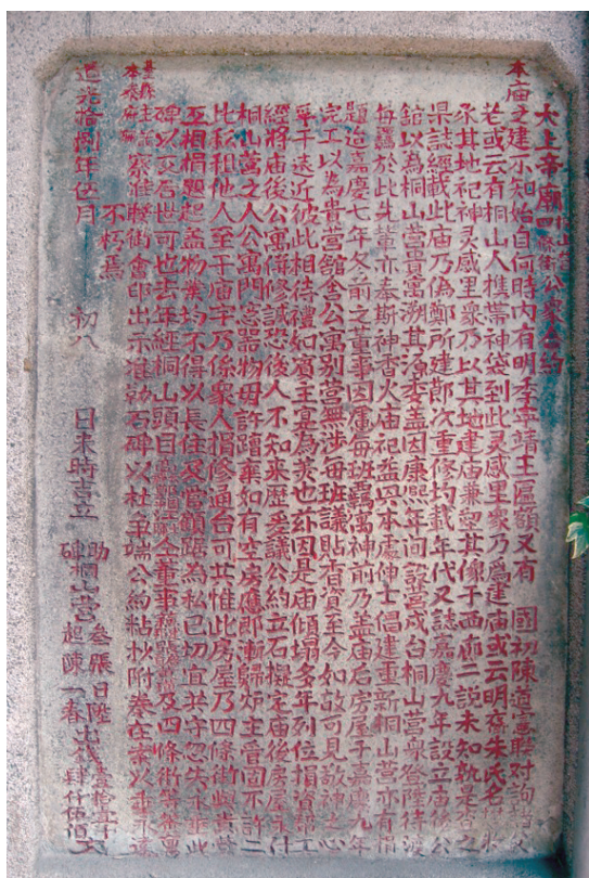
圖五 大上帝廟桐山營四條街公眾合約碑（上）