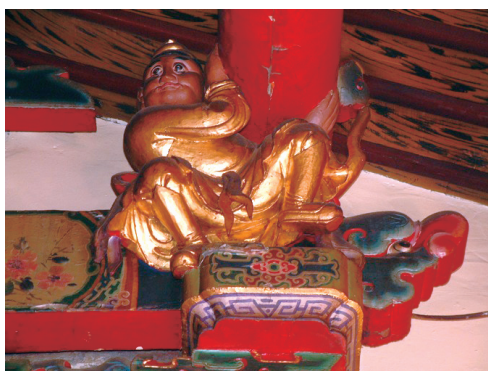
圖四 天壇、一字匾、憨番扛樑

說明：上圖天壇廟旁巷道俗稱「天公埕巷」。中圖為「一字」匾懸掛於正殿出簷下。下圖憨番扛樑，位在三川殿後出簷步口。