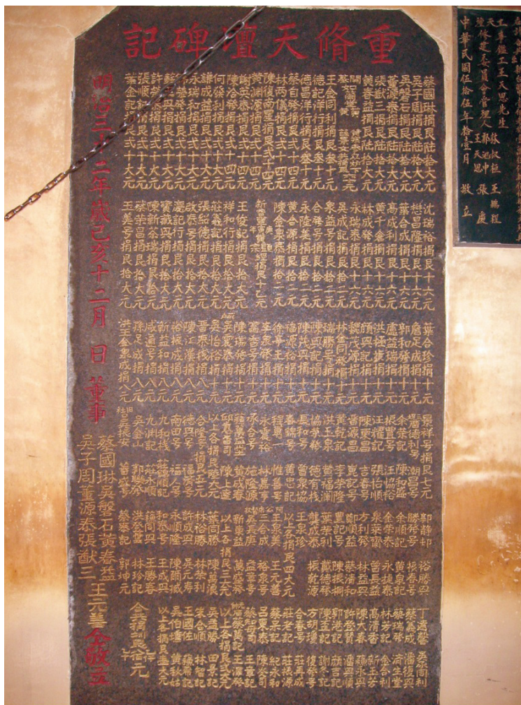
圖九 重修天壇碑記