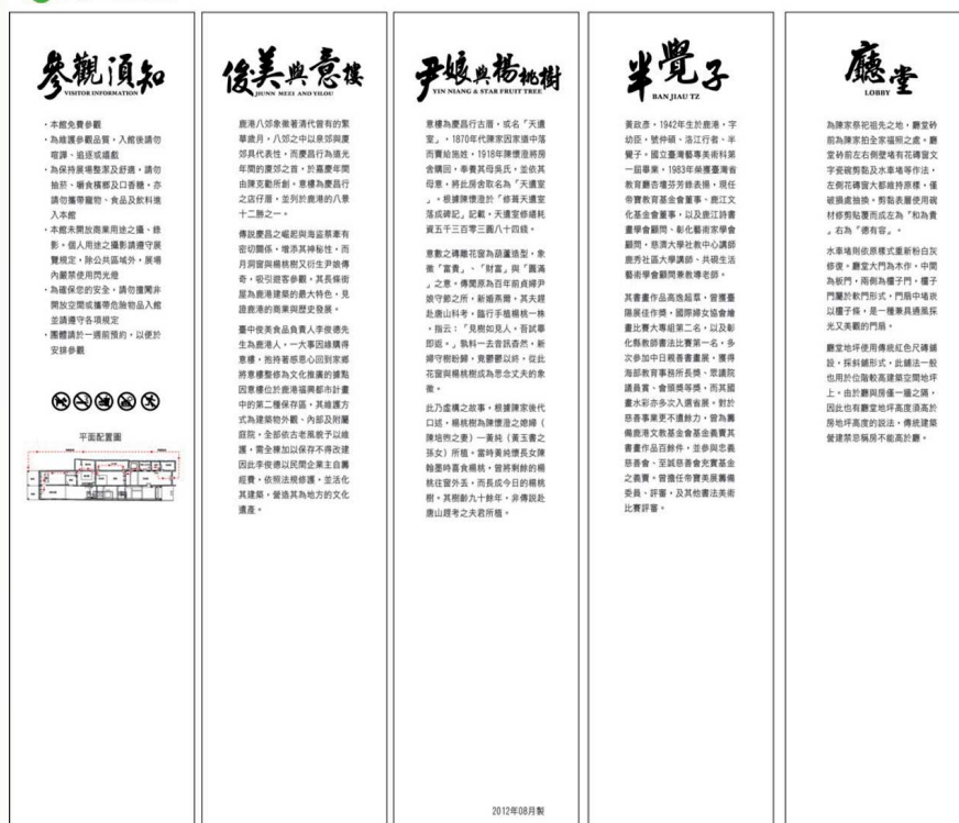
圖11 意樓參觀路線指標示意圖