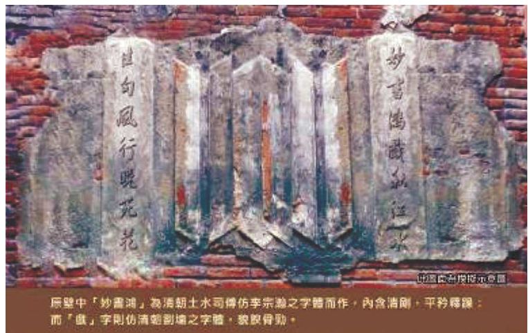
圖5 中庭側邊灰泥雕字假想示意圖

意樓第二進（落）有廳堂及左大房，作為祭祀及居住的空間。廳堂在傳統合院建築中屬較高之空間位階，因此營建手法較講究。廳堂又分為「前廳」、「廳後房」及走廊等空間。意樓廳堂為公媽廳，是為祭祀空間，廳後