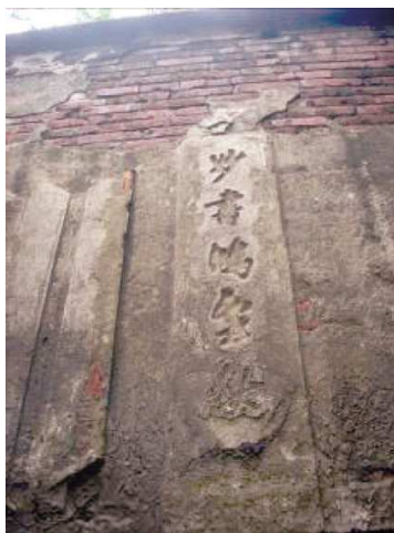
圖4 中庭側邊灰泥雕字修復前