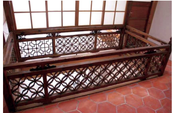
圖3 中山路121號木樓井修復後