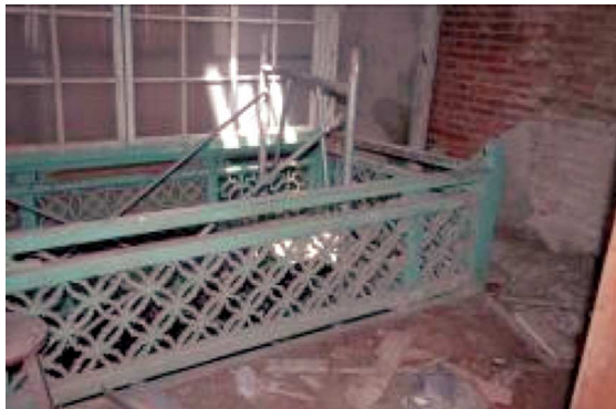
圖2 中山路121號木樓井修復前

間與後方住家空間，以作為主客之間留宿、招待的區隔。意樓的天井邊尚留有清代土水匠司施作的對聯，壁中「妙書鴻」仿清朝李宗瀚字體而作，內含清剛，平矜釋躁；至於「戲」字則仿清朝劉墉之字體，貌腴骨勁。上聯應為「妙書鴻戲秋江水」，下聯已模糊，似為「好句風行曉苑花」，或為「佳句風行曉苑花」。今修復時仍保留原「妙書鴻戲」，但在下方架一模擬示意圖，供參訪者想像其原貌。