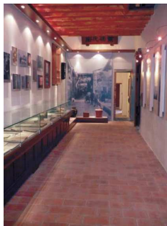
圖14 意樓慶昌故事館