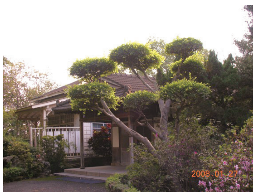
圖6 日糖支社長住所

而日糖任用這些具有重要地位的課長有何特色、原則呢？根據本文整理的人事資料表，可以發現日糖任命支社課長的幾項特色。在糖廠運作中，工務與鐵道課的關係密不可分，營業與會計課屬社內業務經營，因此可以把五課併為工務、營業與農務三部門。分析這三個部門主管的出身，不難發現大日本製糖對於農務、工務與營業，都採取量才適用，學有所用的方針。如農務課長為東京帝國大學、札幌農校體系（北海道大學、東北帝大）的農業科別，尤其是札幌農校體制更包含了六任課長中的四任；工務、鐵道兩課則以東京高工或大學理工科為主；至於營業課長、會計課長則以慶應大學居多，14人有8人為慶應校友，畢業科系不但有理財、經濟，還有政治、法律，可