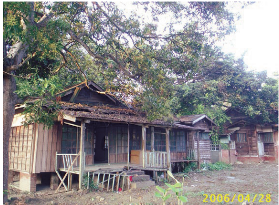
圖7 日糖員工宿舍今貌

人薪資為1.4圓，日人為3圓，日籍員工薪資超過臺籍員工一倍以上。二是由勞工分類來看，製糖工在斗六街內的勞工中屬於薪資較高者，臺籍製糖工的1.4圓雖不比強調專業技術性的大工（木工）、左官（泥水工）、石工、洋服裁縫工，卻超過同屬食品製造業的製麵工（1圓）、醬油釀造工（1.15圓），與水田農夫（1圓）。而日籍製糖工所得僅比大工（3.5圓）少。三是無論日籍或臺籍斗六街糖工，薪資只少於屏東街臺籍糖工（1.8圓），與日籍（3圓）糖工相當，遠高於臺南市、彰化街臺籍製糖工0.9圓，亦勝於其他地區。因此臺籍糖工的薪資不如日籍糖工，但薪資水準在全臺勞工中已是較好待遇，甚至比一些地區的日籍勞工來得高。日糖聘僱的專職勞工，在當時是一份待遇不錯的工作。職工薪資如此，日糖正式社員的薪資自然不惶多讓，1940年辜振甫初任日糖本社事務員時月薪就有75圓，他回憶當時這份薪水可做三套西裝，是相當不錯的待遇。 64 一般而言，日糖日籍資深社員與醫務室醫師的月薪有百圓以上，擔任主管更可達兩百圓以上。 65