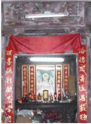
圖4：楊士芳進士第現況