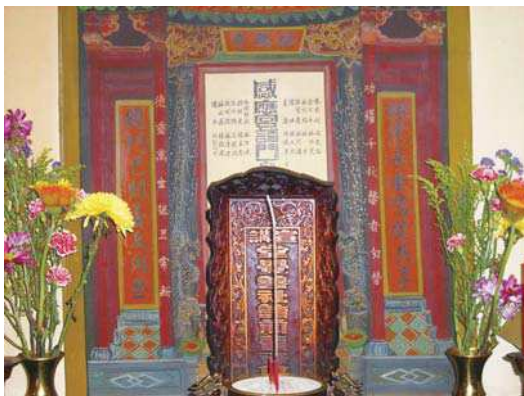
圖7：覺善社諸前輩祿牌位

從上文可得艋舺、大稻埕、宜蘭等地宣講的活動十分盛行，太上感應牌位為宣講時所供奉，筆者從醒世堂的《善錄金篇》中發現，14日子刻，感應宮宣講生求聯：「感善心加防失足，宣先言皆有報應，應逸志速早回頭，講爾聽總要留心。」 64 感應宮的沿革也提到宣講聖諭，教化百姓。從這可以得知感應宮曾有一段時間，在宜蘭扮演著勸善教化的功用。那覺善社的文物會流落於感應宮，而感應宮創建清道光6年（1826）由清朝進士楊士芳所創建，筆者並沒有掌握到很多資料不敢下定論。