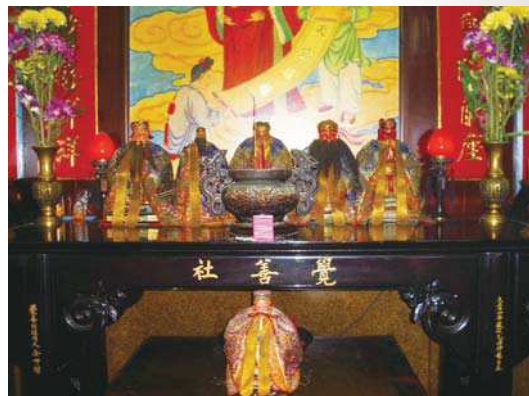
圖8：大正14年（1925）放置感應宮內覺善社的供桌