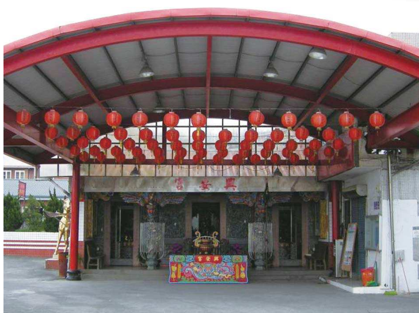
圖9：挽善堂現在改名為興安宮

筆者找尋許多資料並未發現有關《金篇玉錄》的記載。而從上文得知《奇夢新篇》「發挽良途」，《渡世慈帆》「發善藥詠於前」、「挽善回丹鳳」可以得知發善堂與挽善堂 132 也是屬於堂開九處的系統。