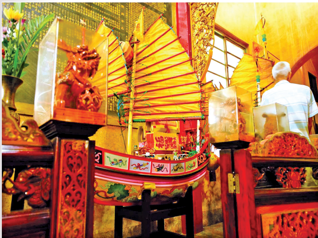
圖 2：後塭仔嘉蓮宮左邊偏殿的兩艘王船