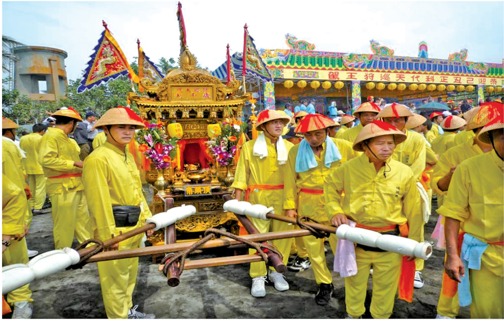
圖 8：頂頭角轎班之大千歲神轎於請水台前候駕