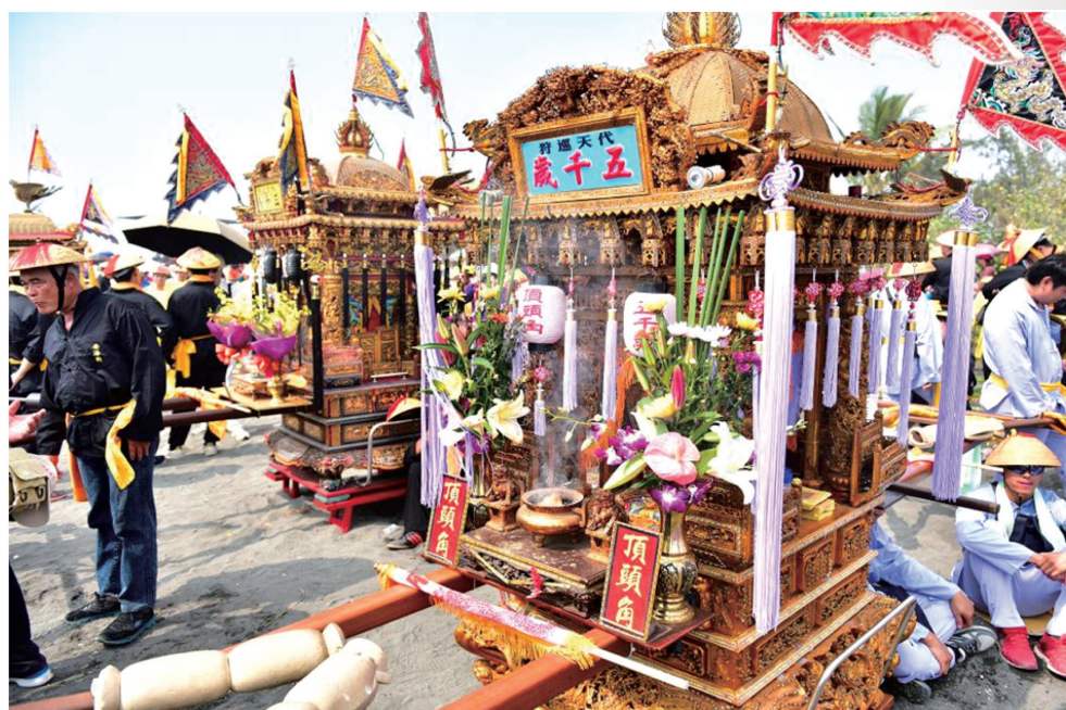
圖 7：頂頭角轎班之百年大轎（1913～）

口述，原頂頭角神轎上之四根龍柱，乃所謂內枝外葉的細緻雕工，蟠龍翻江倒海，祥雲栩栩靄靄，實為當代木雕佳作。仔細觀察頂中街及頂頭角的百年大轎的現況，頂中街仍保留原漆色，頂頭角已再髹上一層金漆，惟仔細比較兩頂大轎之轎頂、轎垛型制手法均至為相似，惟龍柱雕刻、部份細節風格不同而已，除此之外，頂中街於 1973 年打造一頂純白銀鳳凰轎冠，裝置於神轎的轎頂之上，成為頂中街神轎與其他角頭不同之處。而且東港七角頭神轎都不斷耗費巨資，安裝炫麗的 LED 燈飾，而且只要感覺落後其他角頭，即會重新訂作更加新穎的燈飾，惟貼上了 LED 燈飾的線條，部份阻礙欣賞原先精彩的神轎木雕工藝，然而炫耀奪目的燈飾，卻有各角頭間相互較勁的意味，成為東港迎王祭典中的特色，亦顯示了七角頭轎班對神轎重視的程度。2009 年，超過 96 歲歷史的頂頭角神轎，在頂頭角轎班悉心的維護下，依例掛上專屬大千歲的黃色流蘇與彩結，何等榮耀地成為大千歲的座轎。