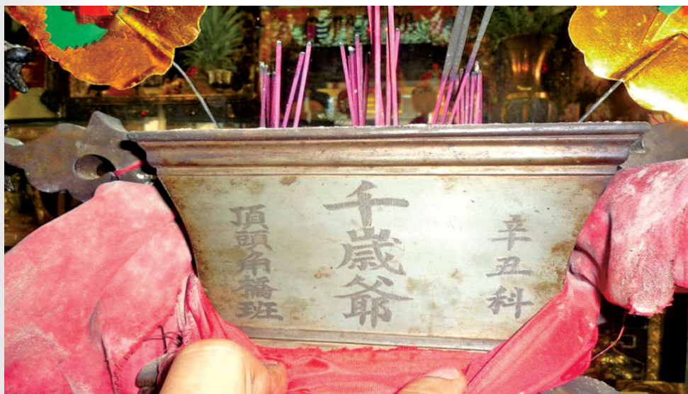
圖 6：頂頭角轎班之轎班爐

織，但是臺南的「聯境」組織除了祭祀功能、尚有維護地方治安的功能。 13 即府城十聯境，有二十一境（大上帝廟）、十八境（縣城隍廟）、八協境（大人廟）、六合境（開山王廟）、八吉境（總趕宮）、六興境（開山宮）、六和境（祀典武廟）、四安境（良皇宮）、三協境（風神廟）及七合境（集福宮）。另外有枋寮鄉水底寮庄之五角頭，即是下頭角（保安宮）、公館前角（保寧宮）、巷仔內角（神農宮）、寮內角（梅山壇）及埔口角（五龍寺）等等。這些聯境與角頭，由於聚落的社會變遷衝擊，經濟繁華不再，信眾遷出減少，而僅存部份功能或轉型。能夠像東港七角頭轎班祖先們，代代相傳於不墜，堅持信仰永薪傳，臺灣地區堪稱碩果僅存。