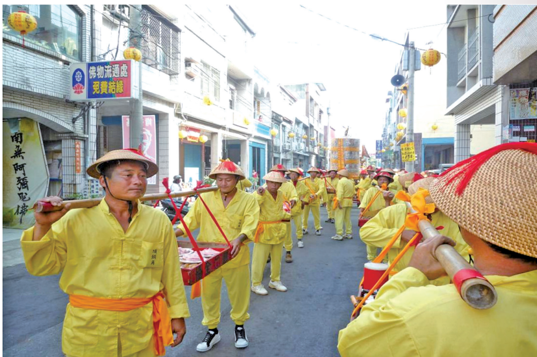
圖 11：轎班扛「櫨」，準備進王府祀王