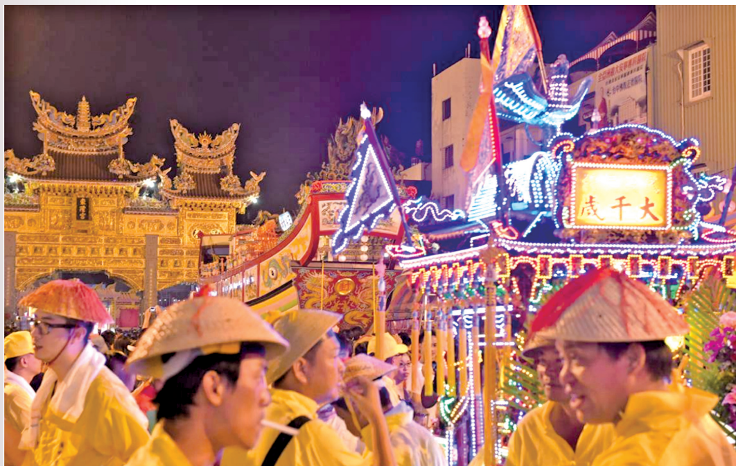
圖 14：大千歲轎班徹夜顧守王船

俟大總理宴王結束，即進行送王，旗竿降下帥旗帥燈，頂頭角轎班一部肩扛大千歲神轎，一部拖曳王船，直接由東隆宮廟埕拖曳至鎮海公園沙灘，這段路頂頭角轎班是萬般依依不捨。抵達送王位置後，七角頭轎班與王船組合力將王船架好，準備揚帆起航，大總理即自頂頭角神轎，奉請大千歲王令上王船，此時，大千歲的頭簽降駕，向七角頭轎班與現場信眾揮手道別，感謝全鎮連日來的殷切款待，稍後鳴炮恭送王駕，轎班們卸下魯笠、腰帶，大千歲轎班的職責即告一段落。