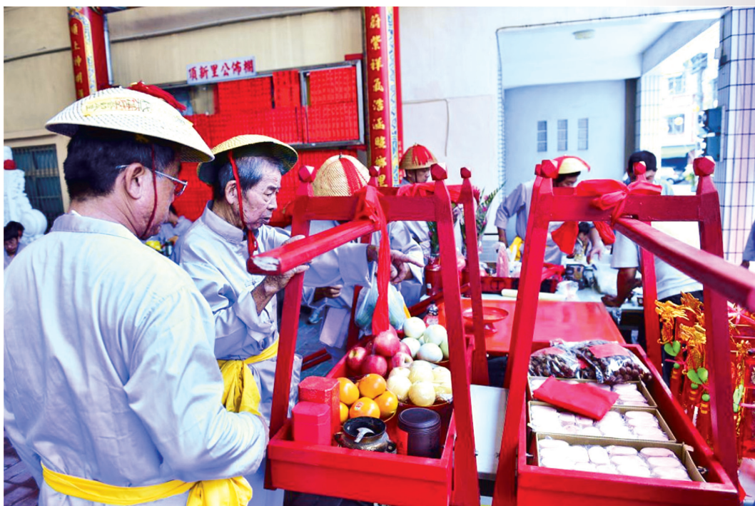
圖 10：頂頭角轎班集合準備祀王