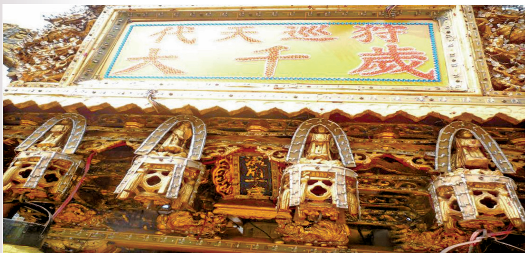
圖 4：頂頭角百年大轎之聖旨牌「溫府千歲」

博物館），四頂大轎匾額分別書「溫府千歲」、「東隆宮溫府千歲」、「頂中街東隆宮」、「安海街東隆宮」。可見推斷先有東隆宮之後，才發展出七角頭轎班的組織，也代表各角頭轎班的主神即「溫府千歲」，亦可說七角頭轎班隸屬於東隆宮。也證明七角頭耆老們的說法，七角頭轎班平時乃歸屬東隆宮溫府千歲的轎班，迎王時才分別擔任代天巡狩千歲爺的轎班。四、七角頭轎班的寶蓋涼傘之上層「銜頭」，七角頭轎班的涼傘編制大同小異，演變迄今，均有七隻涼傘編制，除了顏色相同，分別為藍色、白色、淡紫色、綠色、黑色、水紅色及黃色各乙支，各代表溫府千歲、中軍府、五千歲、四千歲、三千歲、二千歲及大千歲的識別顏色。每隻涼傘的彩繡，從古早延續至今，每一支涼傘分三層刺繡，下層繡龍鳳、祥雲，中層繡八仙人物，上層繡大字「東津東隆宮溫府千歲頂頭角（下頭角、頂中街、下中街、安海街、崙仔頂角及埔仔角）」，亦代表七角頭轎班就是東港東隆宮溫府千歲麾下所轄之轎班。先有東隆宮再發展出七角頭轎班。