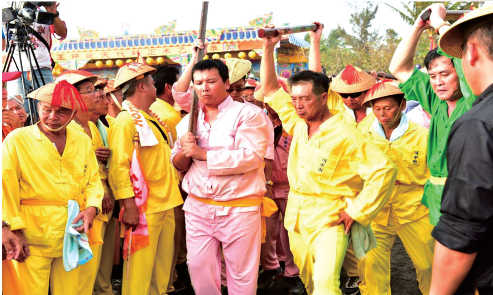
圖 9：大千歲、二千歲頭籤