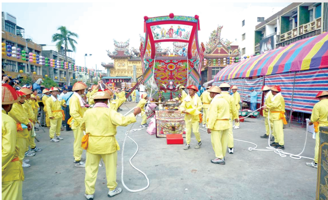
圖 13：大千歲轎班準備拖曳王船