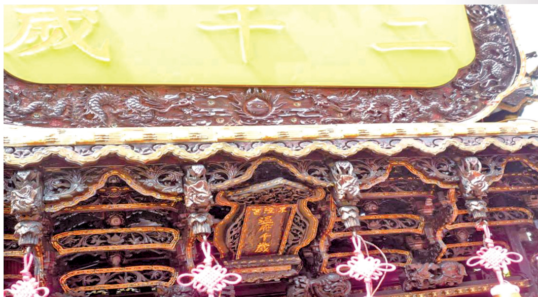
圖 5：下頭角百年大轎之聖旨牌「東隆宮溫府千歲」