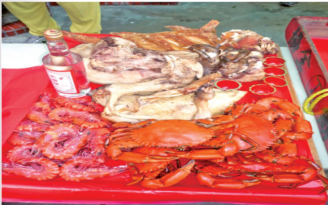
圖 12：轎班準備豐盛的「大五牲」