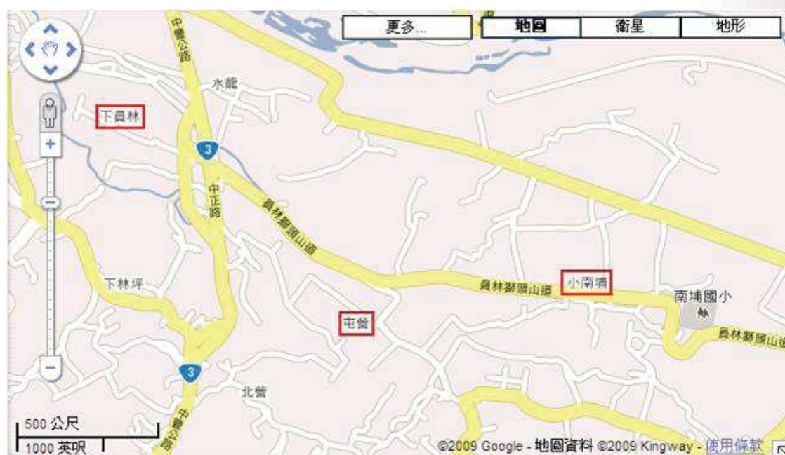
圖 1：小南埔、屯營、下員林相對位置圖

客家人，以前是住在山區，後來才搬出來。栢屋族人生活較苦，因此在社區捐獻上，他們雖有出錢，但金額不算大。在這四個姓氏中，栢姓是較窮的一個姓氏。