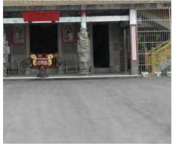
圖 4：小南埔崇聖宮（育化堂）