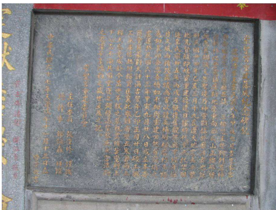
圖 5：崇聖宮（育化堂）落成紀念碑文