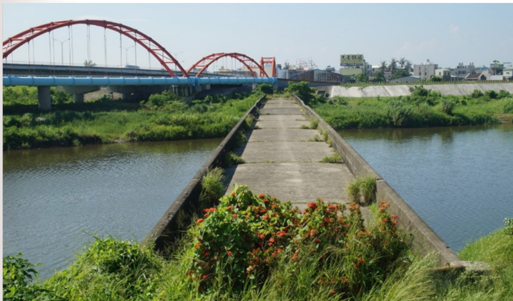
圖 6 跨越二層行溪的二層行溪舊公路橋，現為臺南市歷史建築。

大雨將原有的竹搭便橋沖毀，應該是會走竹架簡易橋樑，即使 10 月是溪水較為乾涸的時期，筆者認為巴克禮一行人涉水走過二層行溪的可能性極低。