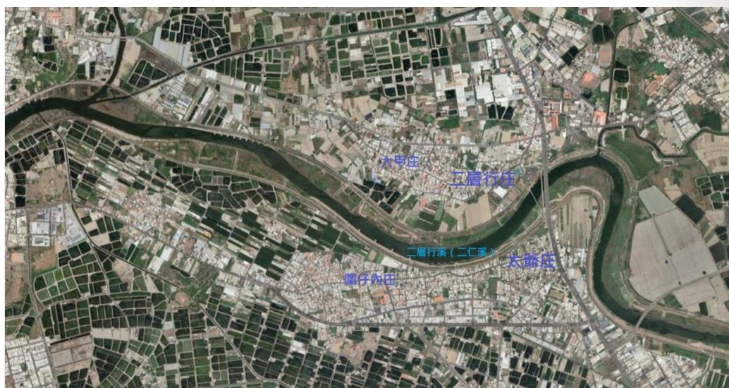
圖 4 今天的二層行庄、太爺庄與二層行溪。