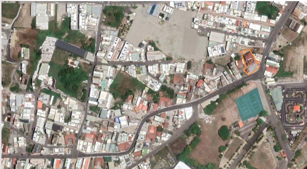
圖 5 今日的二層行與庄廟清王宮

巴克禮在二層行庄內所見的軍官即是日軍前衛部隊司令官山口素臣，當時宿營的農舍，據前島信次的調查，位於二層行庄內某戶民宅。該民宅位於今日二行里何處？實地查訪，由於時隔 120 餘年，地方耆老皆已無法指認明確的位置。