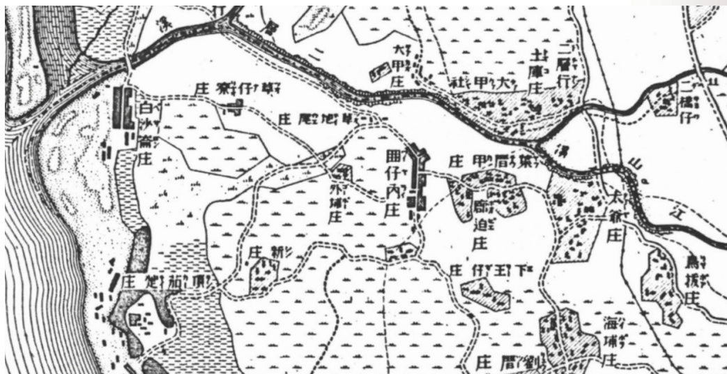
圖 3 1895 年的二層行庄、太爺庄與二層行溪。

一處是巴克禮等人與日軍前衛部隊司令官山口素臣會面處，即前衛部隊的宿營地，此即二層行庄；一處是巴克禮與第二師團司令乃木希典會面處，即第二師團司令部宿營地太爺庄。