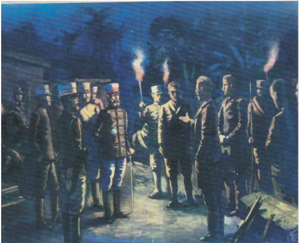
圖 13 小早川篤四郎於 1935 年所繪巴克禮博士一行人與日軍第二師團長乃木希典交涉情境

巴克禮牧師、宋忠堅牧師與乃木希典將軍會面及日軍進臺南城畫作在當年的臺南歷史館中長期展示，戰後，原畫輾轉移置於今鄭成功文物館收藏。