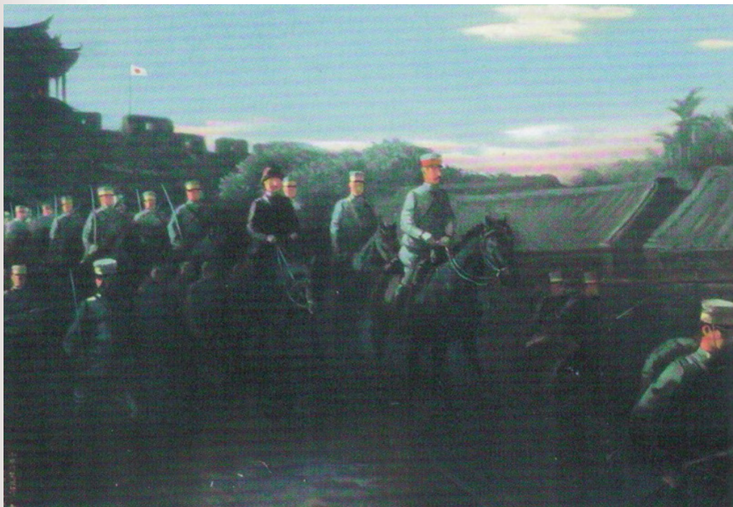
圖 14 畫家小早川篤四郎於 1935 年所繪巴克禮牧師等人帶領日軍進臺南城情境