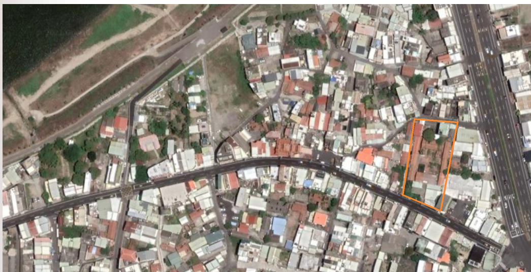
圖 8：蘇應元大厝位置

乃木希典宿營的房舍，據前島信次的調查記錄，在蘇應元古厝南面第一棟建築（即第一落）側邊的房間。 41 另，蘇淑芬〈高雄太爺蘇家之歷史發展及其古厝〉一文，指出乃木希典當晚住的房間就在正廳左邊的小房間。研究團隊於 2017 年 7 月間到太爺蘇家古厝田野調查，據蘇應元家族後人蘇崇焜告知，其家族傳述當年乃木希典將軍就住在右外護龍的房間，清晨部隊在中庭集合，以致中庭的地磚被馬蹄踏破，至今紅色地磚的裂痕仍清楚可見。 42