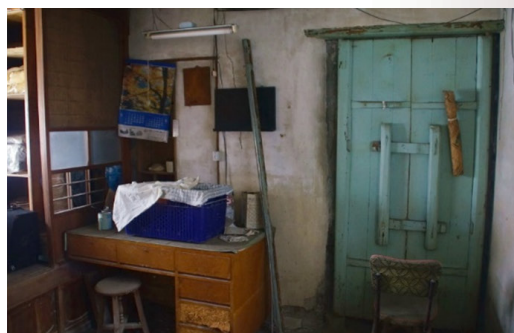
圖 12 蘇應元大厝右外護龍的房間，蘇崇焜表示，該坊間即是乃木將軍宿營房舍。