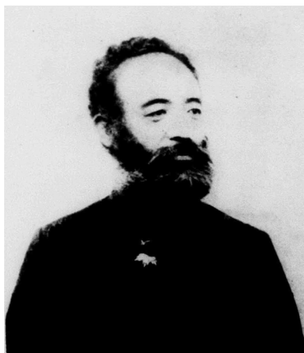
圖1 第二師團司令乃木希典

1895年4月17日馬關條約（日本稱為下之關條約）簽定，清朝將臺灣割讓給日本，唐景崧、丘逢甲與劉永福等人建立「臺灣民主國」，聯絡臺灣仕紳，以抵抗日本統治，因而爆發乙未戰爭。6月4日傍晚，臺灣民主國總統唐景崧帶著銀兩逃出臺北，搭上德國商輪從淡水逃往廈門。臺北城頓時陷入無政府狀態，亂兵、暴民四處劫掠。劉永福駐守於鳳山縣旗後街。6月26日，餘眾在臺南擁立民主國大將軍劉永福為第二任大總統，遷都臺南，號稱南都，設總統府於大天后宮。日軍挾現代化武器，擊敗各地反抗軍南下。