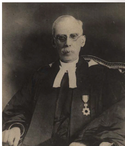
圖 2 巴克禮牧師

巴克禮、宋忠堅兩牧師等一行人共 21 人及一匹馬，拿著府城仕紳們的請願書，由臺南府城的小南門往二層行溪前進，一路上「點著燈籠，唱著詩歌，好讓日本人明白我們並不是偷偷摸摸地潛近。」 26 走了 5、6 英哩在晚上 9 點遇到日軍的哨站，「接著我們被帶去見一位軍官，他駐紮在一幢福爾摩沙人的農舍裡。這位軍官依正規程序查問我們的來意。院子裡擺了一張桌子，我們和他坐了下來，同桌還有一位懂英語的通譯——我們後來得知他是日本某報社的隨軍採訪記者。另有一位秘書紀錄我們