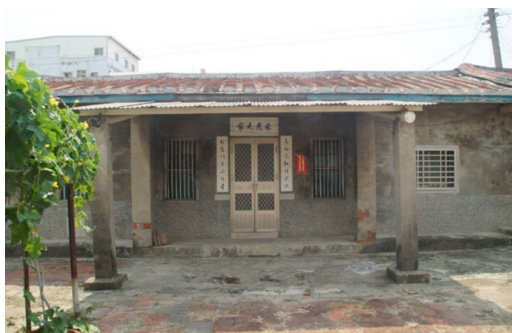
圖 11 蘇應元大厝右護龍