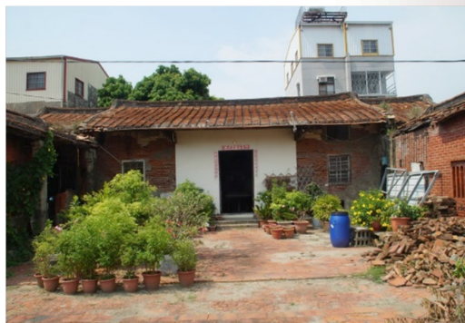
圖 10 蘇應元大厝第二落及中埕