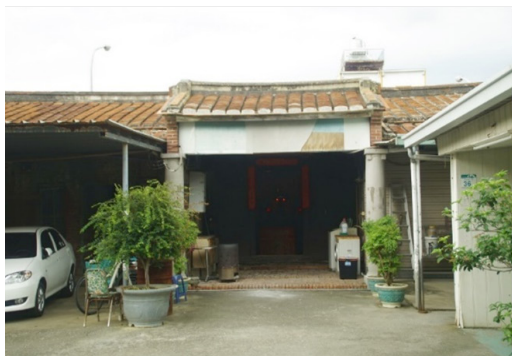
圖 9 蘇應元大厝第一落神明廳及前埕