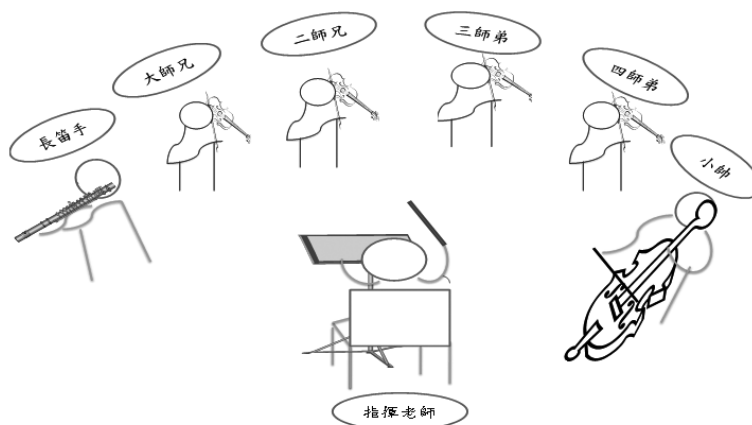
圖一 本研究場域示意圖