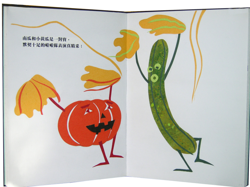
圖 4.2 蕭寶玲，2006，南瓜和小黃瓜，398mm x271mm

繪本創作： 教師將南瓜和小黃瓜的實物影像分別投射在螢幕上，再配合文本「南瓜和小黃瓜是一對寶，默契十足的啦啦隊表演真精采。」提供一張例圖(圖4.2)，圖中的南瓜和小黃瓜分別高舉著啦啦彩球，興高采烈地跳著舞，全圖用彩色棉紙剪貼而成，供學生在課堂創作時的參考。