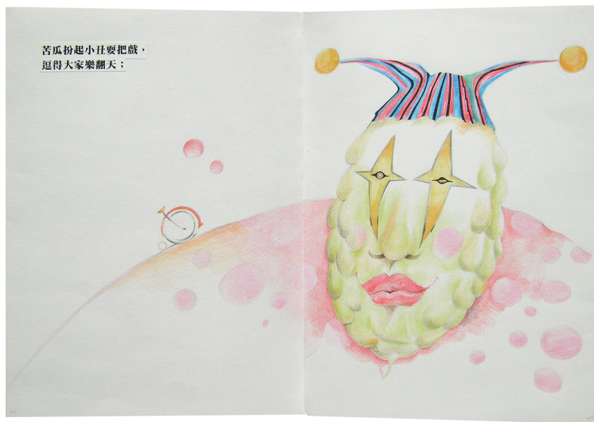
圖 4.3 蕭寶玲，2005，苦瓜小丑，398mm x271mm

圖面右側是戴著小丑帽的苦瓜主題，左頁則留下大量空白，供學生自我發揮。這幅圖畫所採用的工具是彩色鉛筆，學生若選擇畫綠苦瓜，就得多花點時間在苦瓜的臉上；而如果選擇畫白苦瓜，就要花功夫用陰暗面來襯托。學生創作時，「國王最喜愛的小丑」仍以廣播劇的方式經過擴大機重複播放，以強化小丑出場的情境。