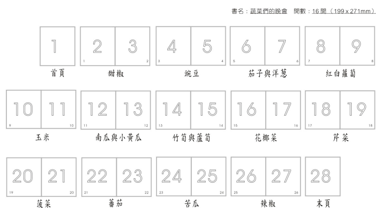
圖 4.1 「蔬菜們的晚會」之頁碼與版面分配

首先進行繪本欣賞，通常以符合當次單元技法的比照為主。其次進行「繪本創作」，以當次主題與內容的比照為主，教師提供蔬菜的圖片以及例圖，還有先前測試班級學員繪製的優秀作品，陸續在螢幕上投影，供學生摹寫或作為創作的參考。整冊繪本共二十八個頁面（圖 4.1），除去前後二個單頁外，共有十三個跨頁，分別描寫十三個表演角色與場景，以下舉二例說明之：