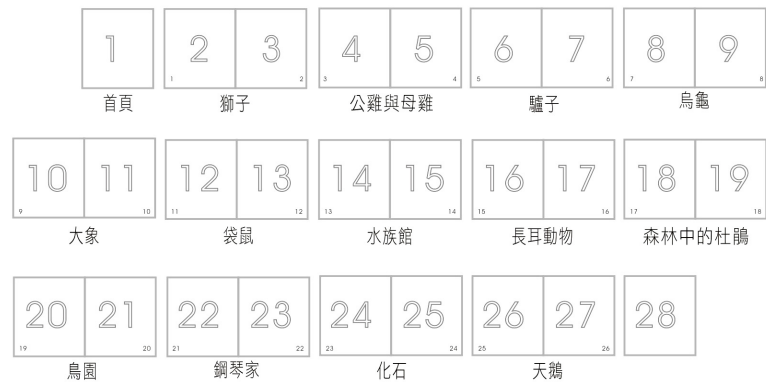
圖 3.1 「動物狂歡節」的頁碼與版面分配